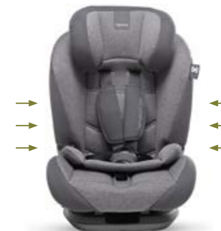
Provisto de tecnología Side Head Protection, cuenta con elementos laterales de EPS que ofrecen una mayor protección frente a golpes laterales. Technologie Side Head Protection, avec inserts en EPS sur toute la structure, pour augmenter l'absorption de l'énergie en cas d'impact latéral.