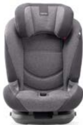
Grupo 2 (desde 15 hasta 25 kg) Groupe 2 (de 15 à 25 kg)