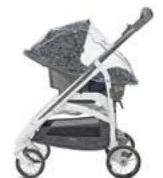
Burbuja para portabebé Huggy Multifix Habillage pluie pour siège auto Huggy Multifix A096FV600