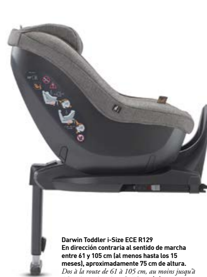
Darwin Toddler i-Size ECE R129 En dirección contraria al sentido de marcha entre 61 y 105 cm (al menos hasta los 15 meses), aproximadamente 75 cm de altura. Dos à la route de 61 à 105 cm, au moins jusqu'à 15 mois, environ jusqu'à 75 cm de hauteur.