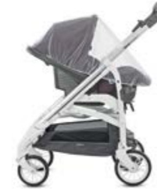
Mosquitera para portabebé Moustiquaire pour siège auto enfant A097KV000