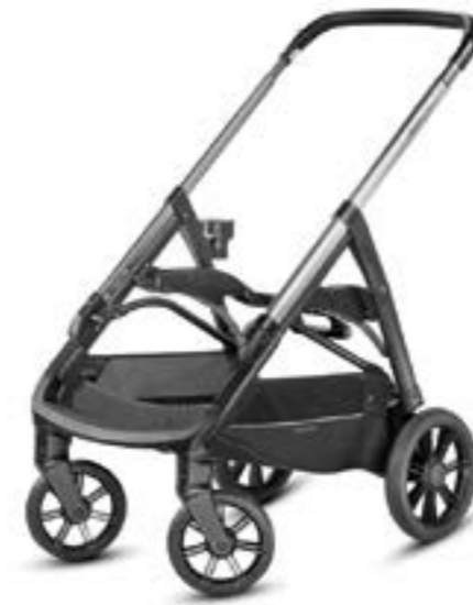
Chasis Negro - Manillar Negro Chassis Noir Coffee AE70M0000