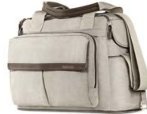
CASHMERE BEIGE AX91M0CMB