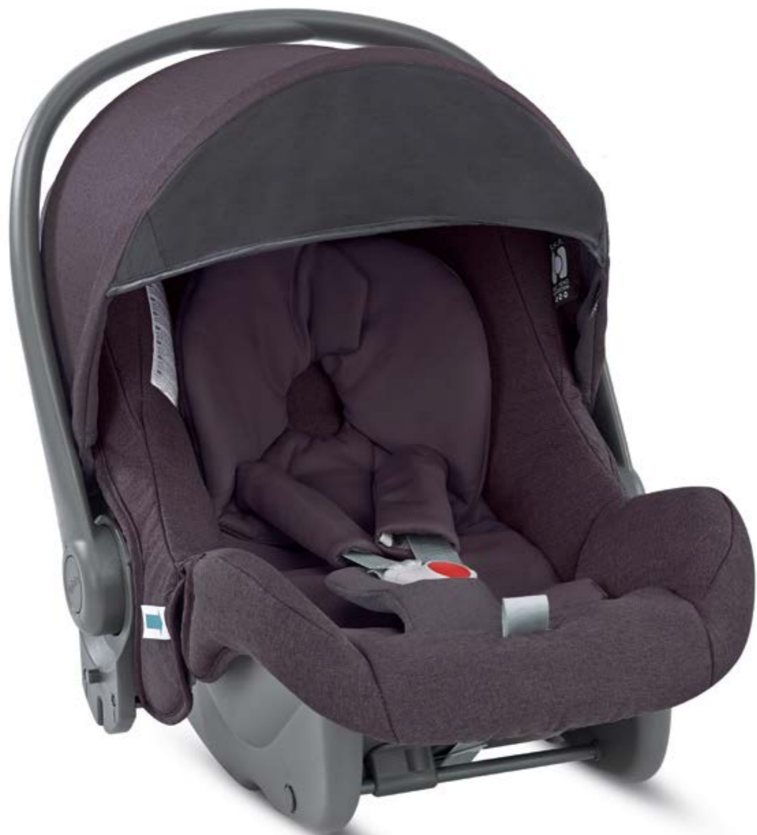
MARRON GLACÉ AV35K6MGL