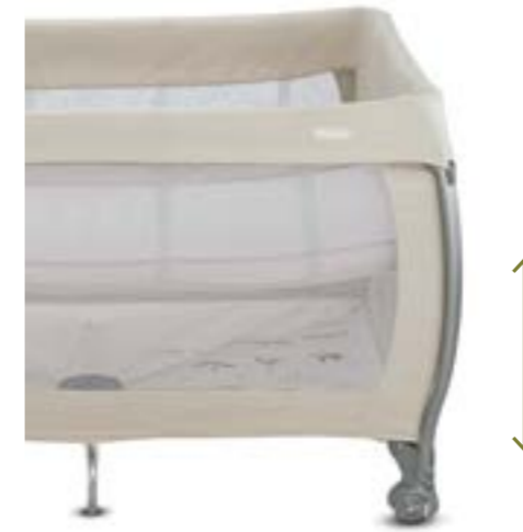
Kit para doble altura colchón. Kit double hauteur du matelas.