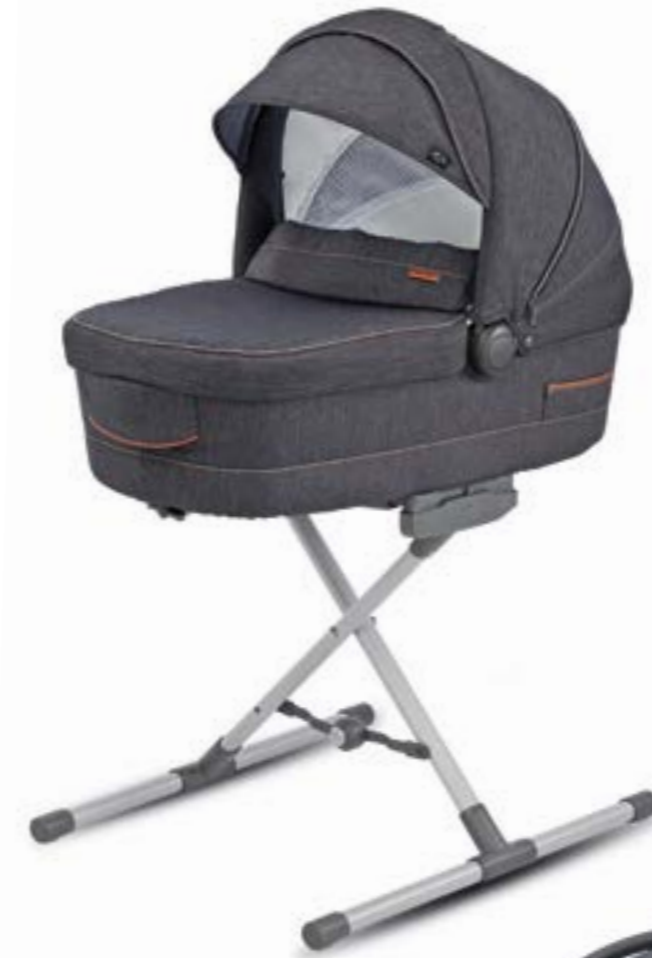
System Quattro KA38K6VLD4 (AA35K6VLD + AE38K6100)