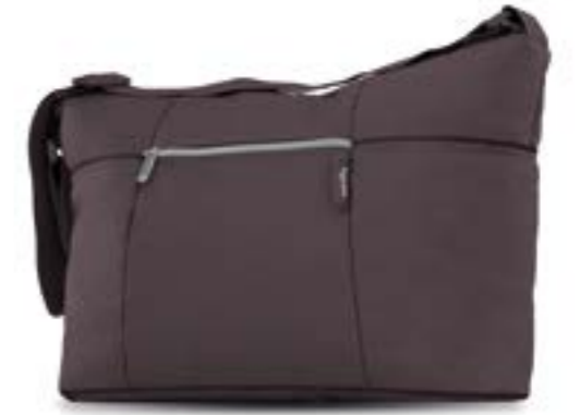
MARRON GLACÉ AX35K0MGL