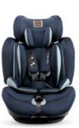
Grupo 1 (de 9 a 18 kg) Groupe 1 (de 9 à 18 kg)