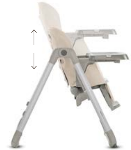
Altura regulable de 4 posiciones. Hauteur réglable en 4 positions.