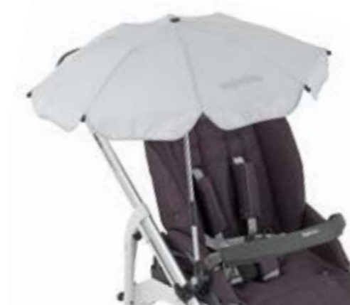
Sombrilla para el sol Ombrelle A099H0BLK · A099H0BLU A099H0CRE · A099H0FUX A099H0GRN · A099H0LBL A099H0RED · A099H0SLV