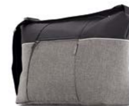
Day Bag AX35M0MKN