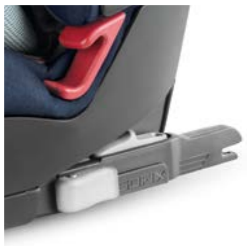
Sistema de anclaje Isofix y Top Tether para una instalación fácil y segura en el coche. Système de retenue pour enfants avec connecteurs Isofix et Top Tether pour une installation sûre et confortable dans la voiture.