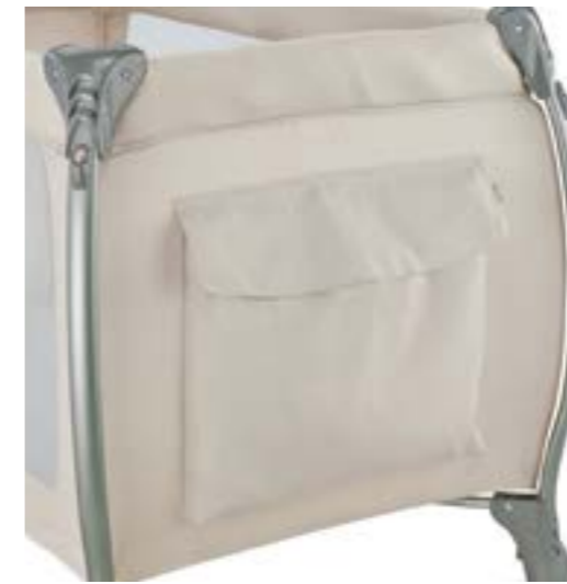
Bolsillo lateral. Poche latérale porte-objets.