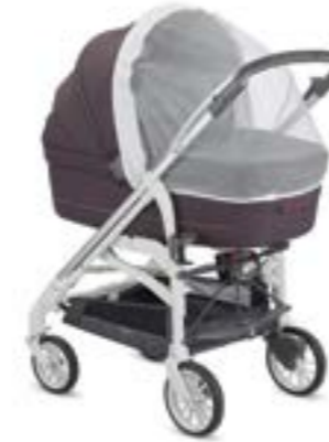
Mosquitera para capazo Moustiquaire pour nacelle A097KB000