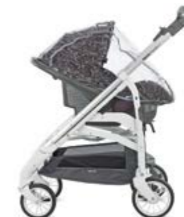
Burbuja para portabebé Huggy Multifix Habillage pluie pour siège auto Huggy Multifix A096FV600