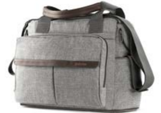
MINERAL GREY AX91M0MNG