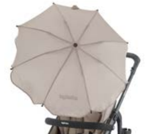
Sombrilla para el sol Ombrelle A099H0BLK • A099H0BLU A099H0CRE • A099H0FUX A099H0GRN • A099H0LBL A099H0RED • A099H0SLV