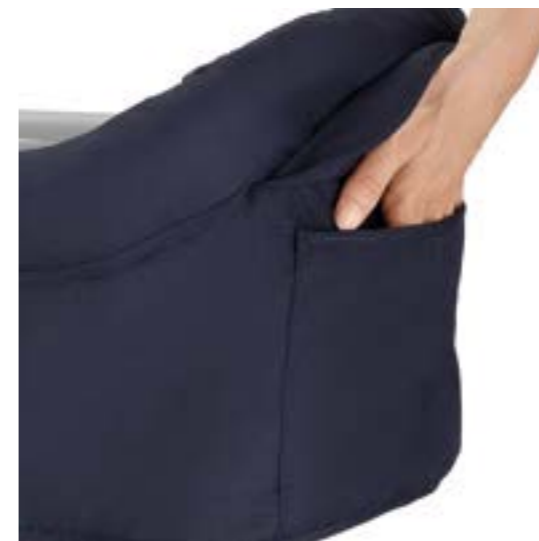
Bolsillo portaobjetos. Poche porte-objets.