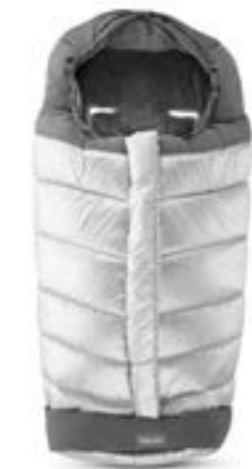
Saco de invierno para sillita de paseo. Descubra todas las variantes en la página 108 Chanceliere pour poussette Découvrez toutes les variantes page 108