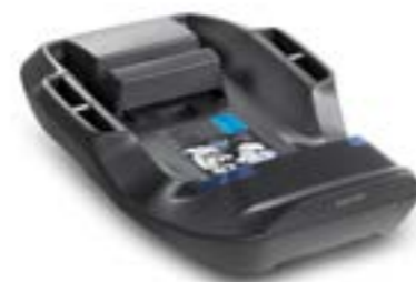
Base universal para portabebé Cab (ECE R44/04) Base universelle pour siège auto Cab (ECE R44/04) AV01K6200