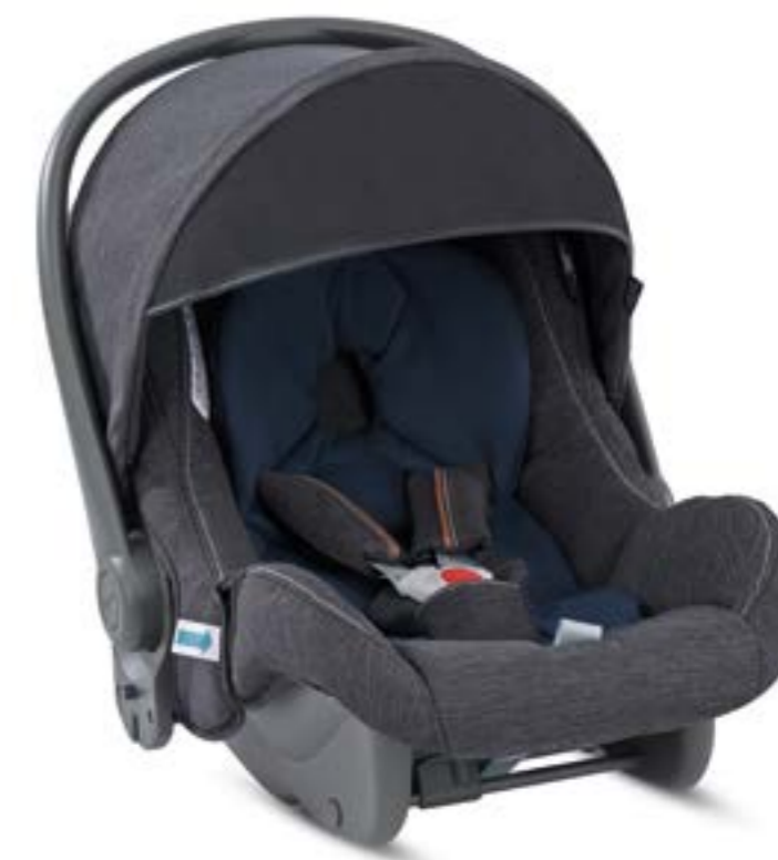
VILLAGE DENIM AV35K6VLD