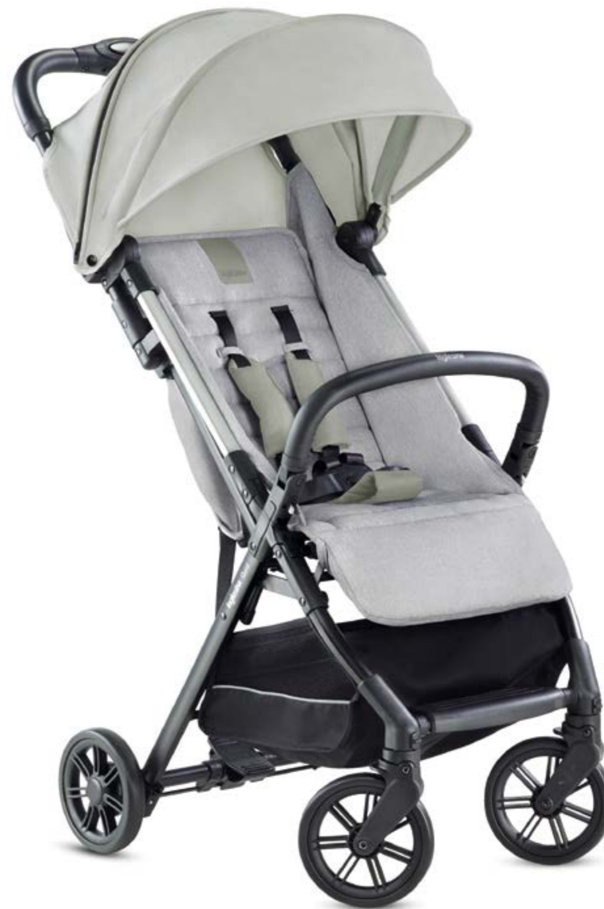
ICE GREY AG87L0ICG