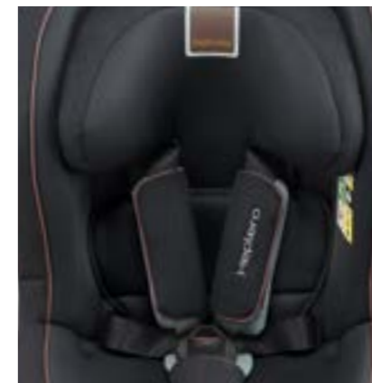
Revestimiento textil desfundable y lavable a mano a 30 °C. Double tissu amovible, lavable à la main à 30 °C.