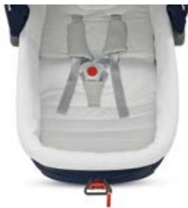
Kit Auto para capazo Kit Auto pour nacelle A090HB350