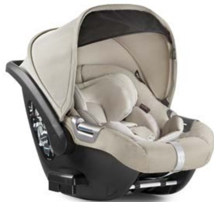
CASHMERE BEIGE AV70K6CMB