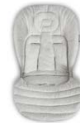
Baby Snug Pad - Cojín reductor Baby Snug Pad - Coussin réducteur A091KC005