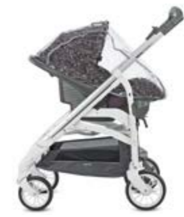
Burbuja para portabebé Huggy Multifix Habillage pluie pour siège auto Huggy Multifix A096FV600