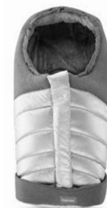
CYBER SILVER A099K2CSL