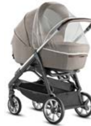
Mosquitera para capazo Moustiquaire pour nacelle A097KB000