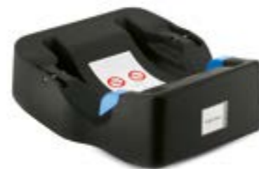
Base Universal para portabebé Huggy Multifix Base Universelle pour siège auto Huggy Multifix AV00D6100