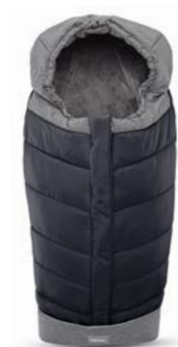
ONYX BLACK A099K1ONB