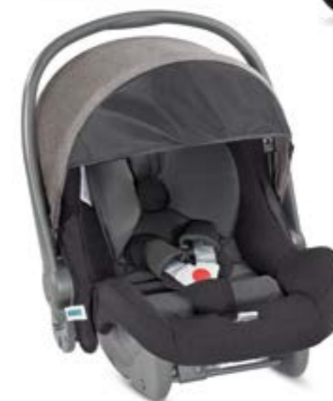
BOLSOS opcionales SAC en option