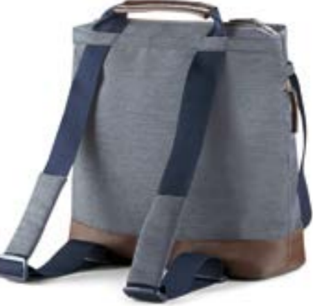
TAILOR DENIM AX70M0TLD