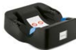
Base Universal para portabebé Huggy Multifix Base Universelle pour siège auto Huggy Multifix AV00D6100