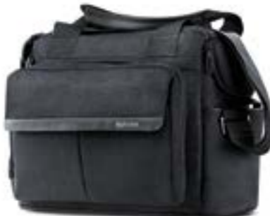
Back Bag AX70M0MYB