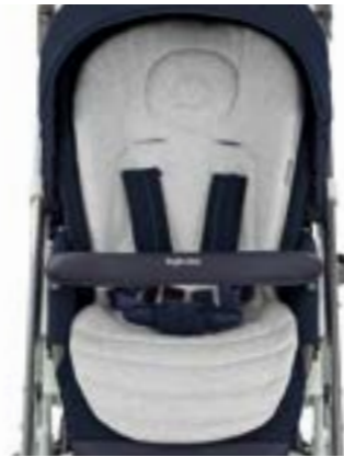
Baby Snug Pad - Cojín reductor Baby Snug Pad - Coussin réducteur A091KC005