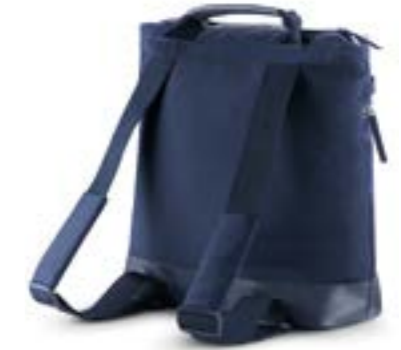
Back Bag - bolso mochila Descubra todas las variantes en la página 116 Back Bag - Sac à dos Découvrez toutes les variantes page 116