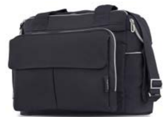
Dual Bag AX91K0PNT