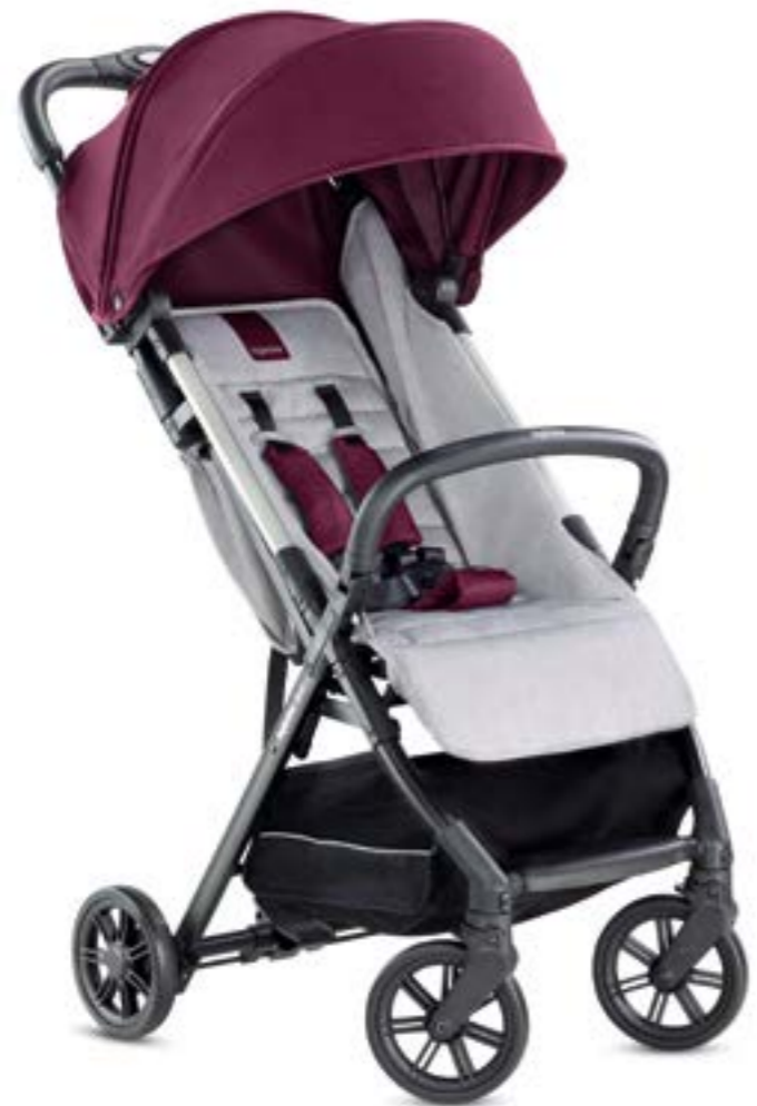
GRAPE RED AG87L0GRR