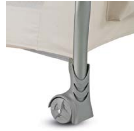
Fácil de transportar gracias a las 2 ruedas. Facile à déplacer grâce aux 2 roues.