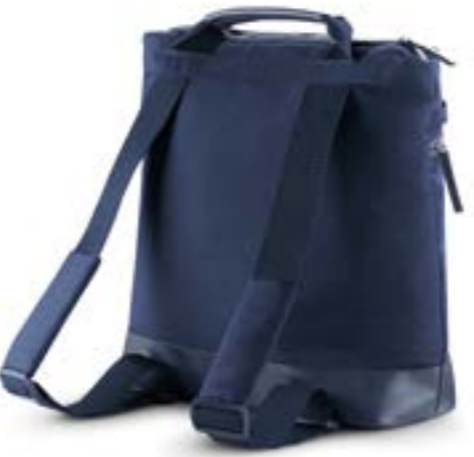
PORTLAND BLUE AX70M0PTB