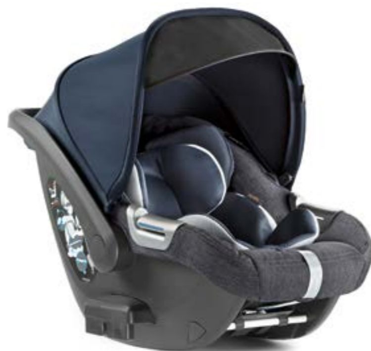
TAILOR DENIM AV70M6TLD