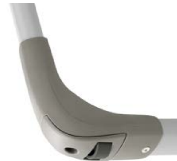
Provista de ruedas traseras. Avec roues à l'arrière.