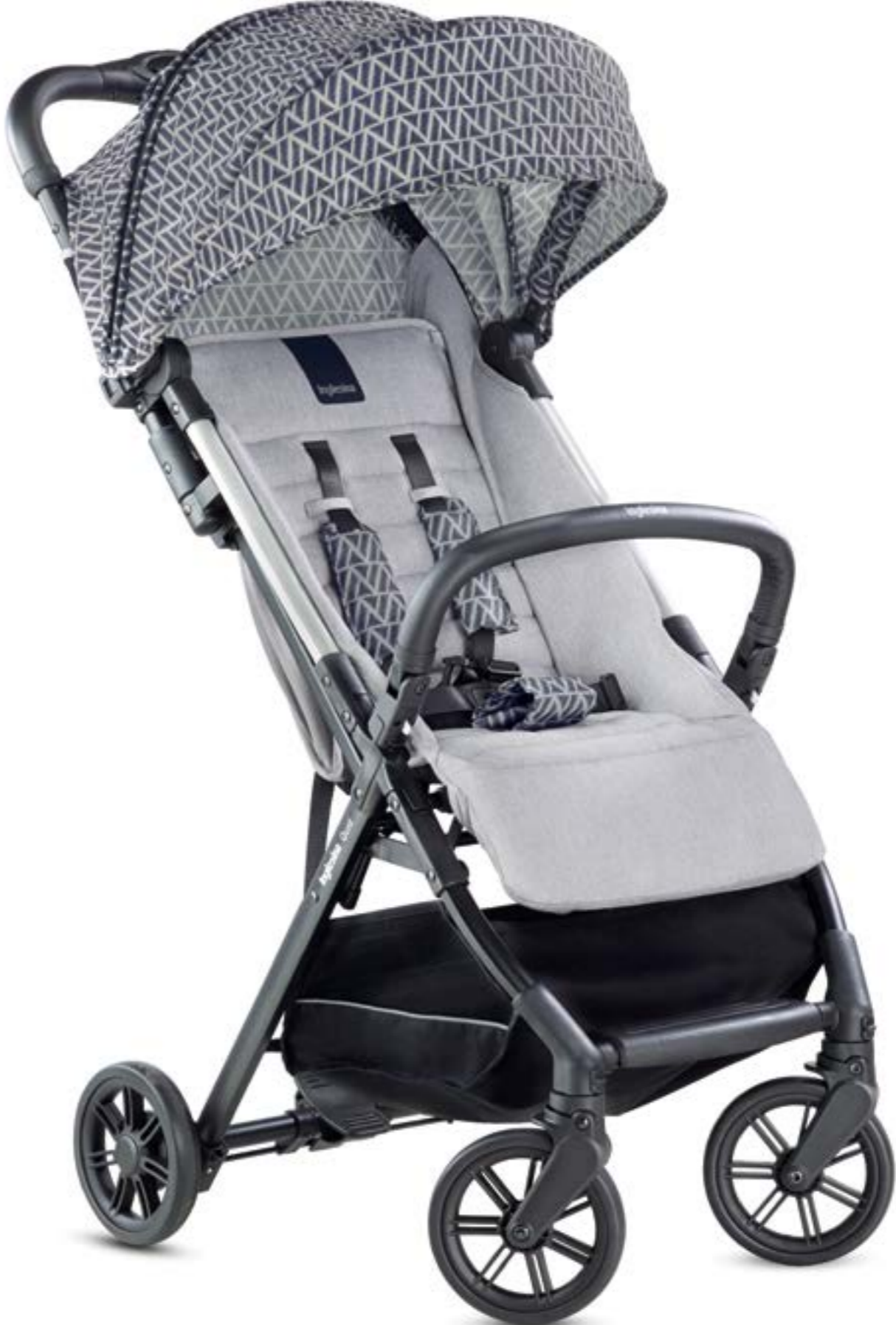
MOSAIC BLUE AG87L0MSB