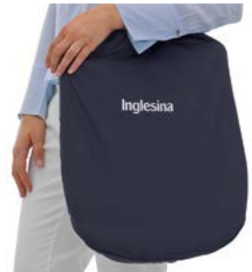
Bolsa de transporte incorporada. Sac de transport intégré.