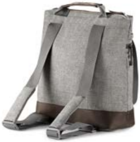
MINERAL GREY AX70M0MNG