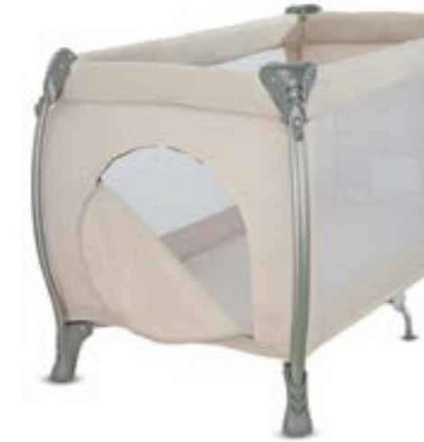
Apertura lateral con cremallera para permitir que el niño entre y salga de forma autónoma. Ouverture latérale avec fermeture éclair, pour permettre à l'enfant d'entrer et de sortir en toute autonomie.