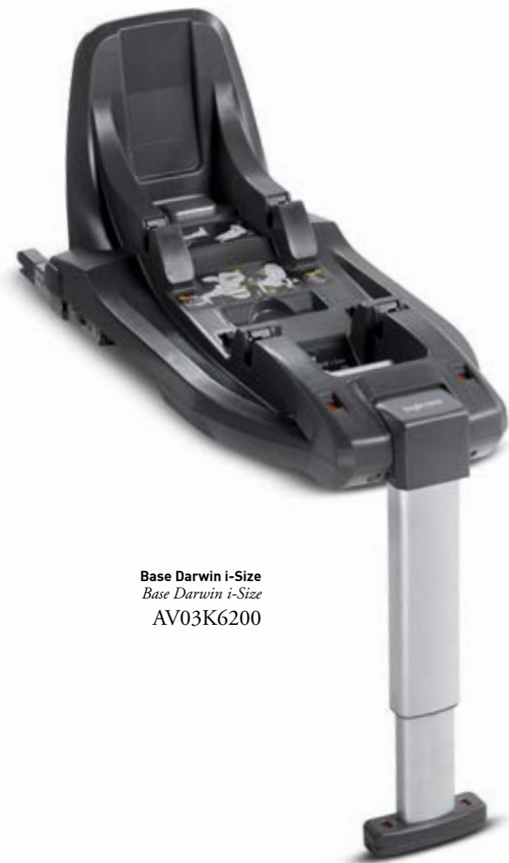
Base Darwin i-Size Base Darwin i-Size AV03K6200

MISMA BASE PARA DOS SILLITAS COCHE MÊME BASE POUR DEUX SIÈGES AUTO