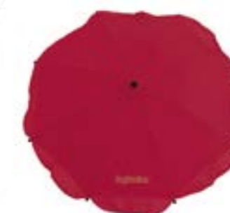
Sombrilla para el sol Ombrelle A099H0BLK • A099H0BLU A099H0CRE • A099H0FUX A099H0GRN • A099H0LBL A099H0RED • A099H0SLV