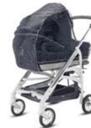
Burbuja para capazo Habillage pluie pour nacelle A096KB000