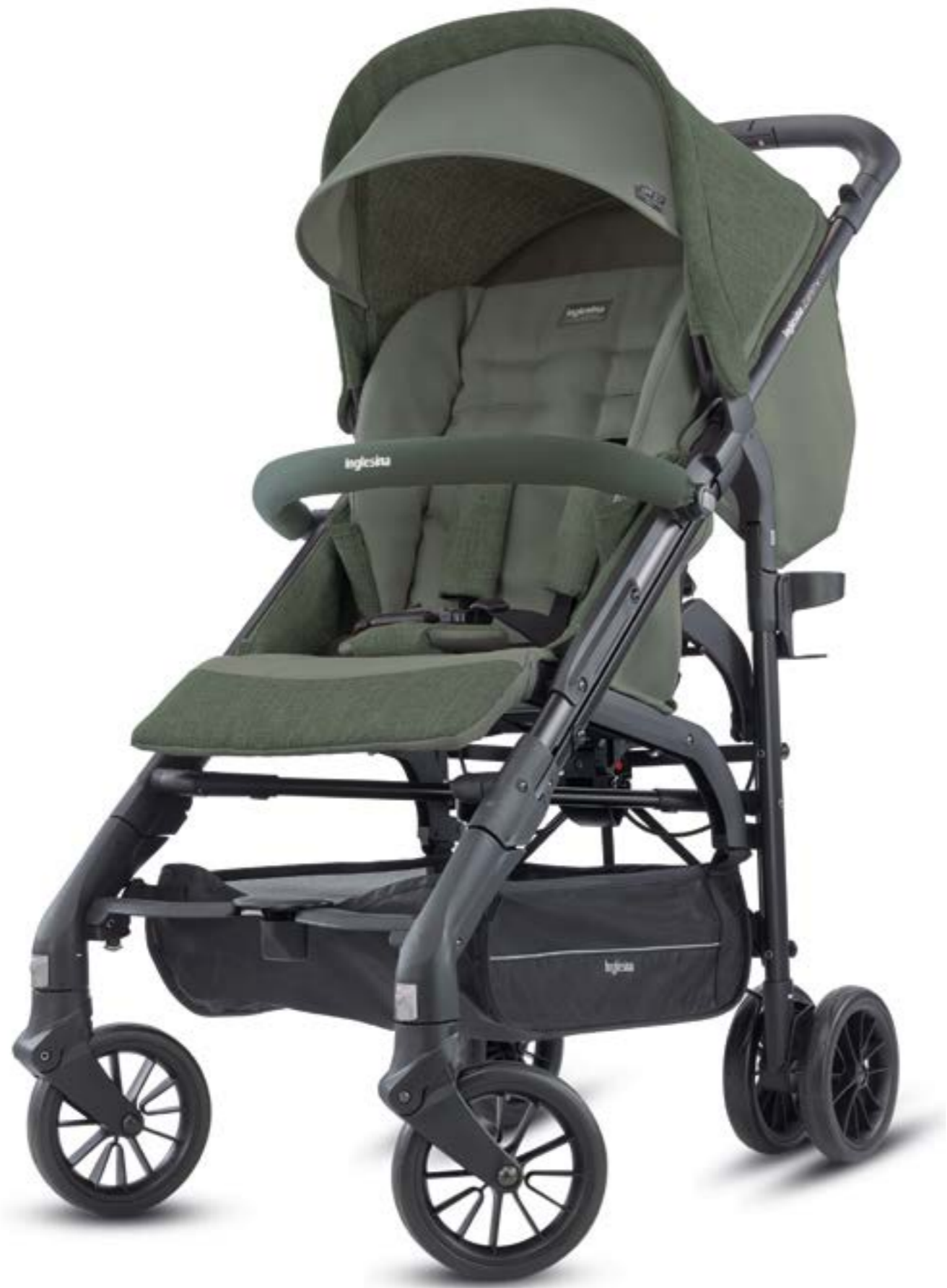
CAMP GREEN AG40K0CPG