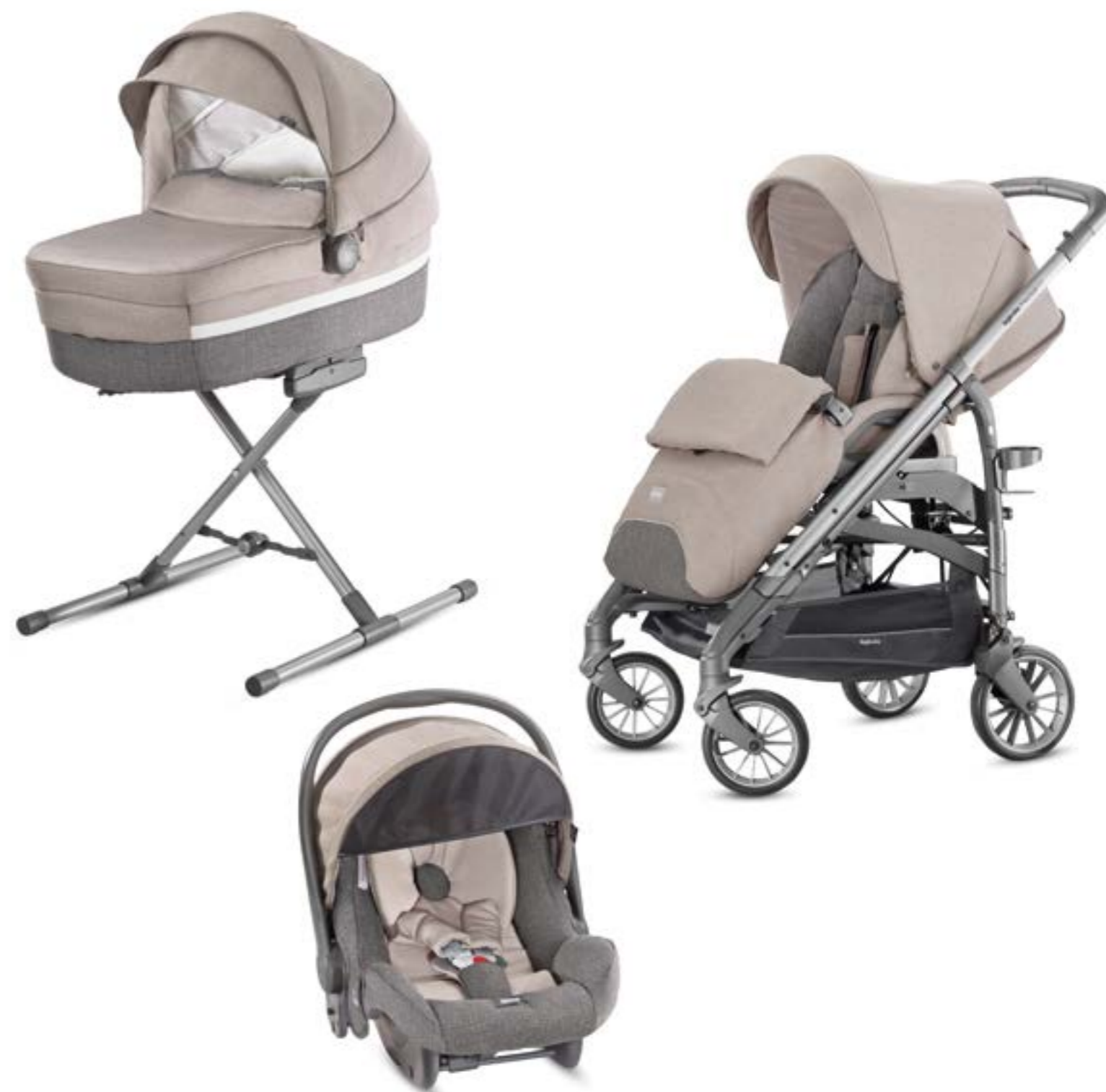
BOLSOS opcionales SAC en option