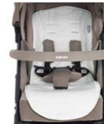
Funda de verano para sillita de paseo Housse d'été pour poussette A095KG003