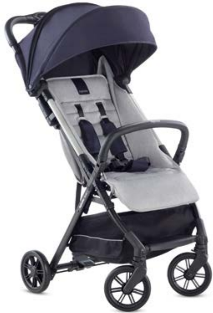
COLLEGE NAVY AG87L0CLN