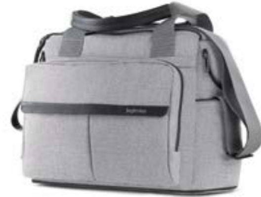
SILK GREY AX91M0SLG