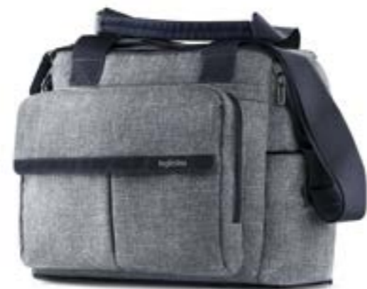
NIAGARA BLUE AX91M0NGB