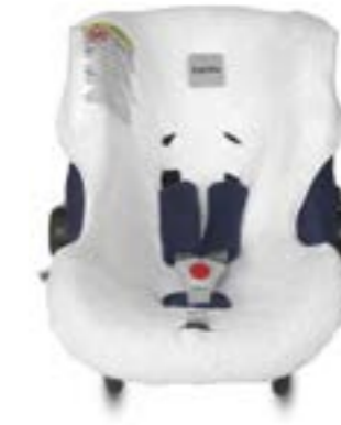
Funda de verano para portabebé Huggy Multifix Housse d'été pour siège auto Huggy Multifix A095FV603