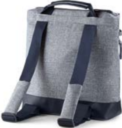
NIAGARA BLUE AX70M0NGB