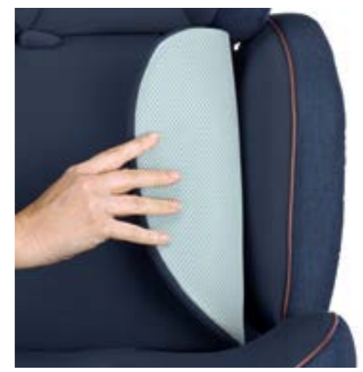
Almohadilla reductora con parte trasera de malla 3D para garantizar a los más pequeños una comodidad máxima. Revestimiento textil completamente desenfundable y lavable a mano a 30 °C. Réducteur en mesh 3D pour assurer un maximum de confort aux bébés plus jeunes. Doublure entièrement amovible, lavable à la main à 30 °C.