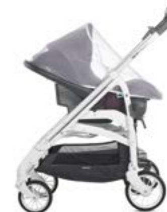
Mosquitera para portabebé Moustiquaire pour siège auto enfant A097KV000