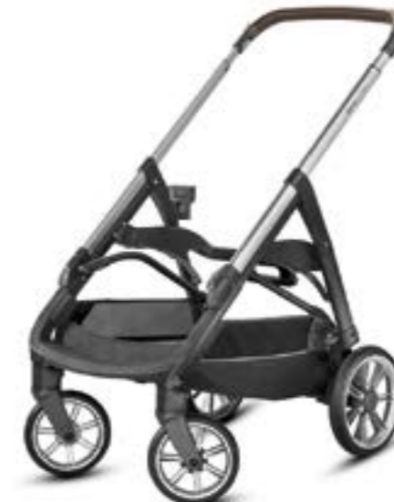
Chasis Grafite - Manillar Marrón Chassis Grafite Coffee AE70M6201