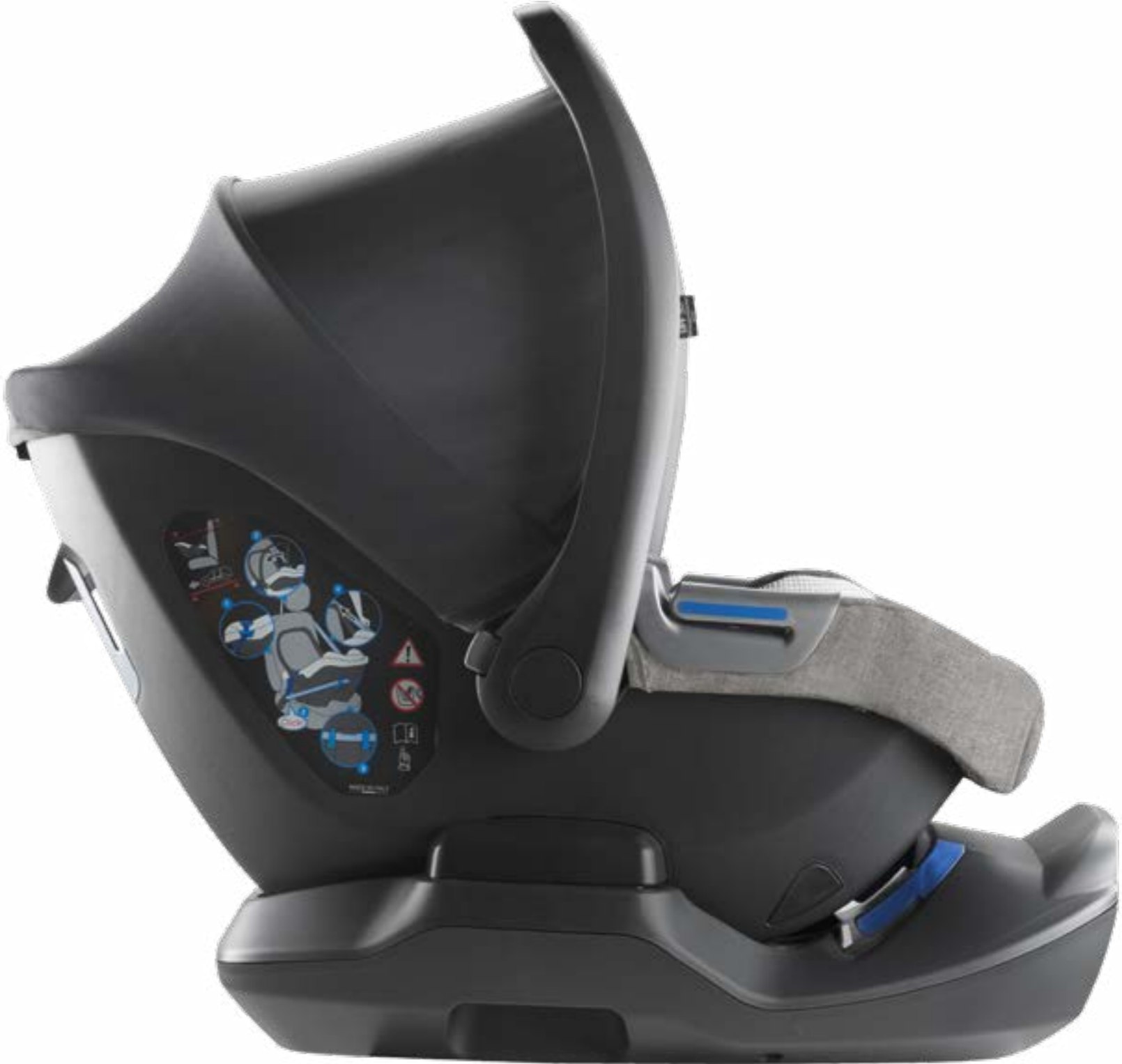
Base auto Cab se puede comprar por separado La base ceinturé Cab peut être achetée séparément