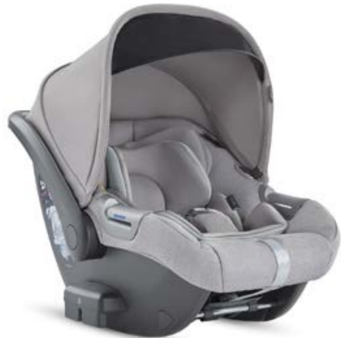
SILK GREY AV71M6SLG