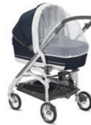
Mosquitera para capazo Moustiquaire pour nacelle A097KB000