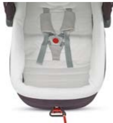
Kit Auto para capazo Kit Auto pour nacelle A090HB350