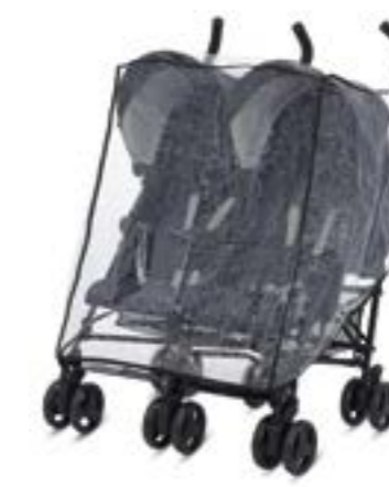
Burbuja para sillita de paseo Habillage pluie pour poussette A096AH840