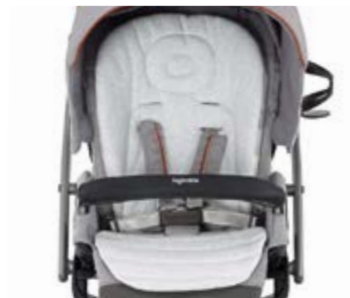
Baby Snug Pad - Cojín reductor Baby Snug Pad - Coussin réducteur A091KC005