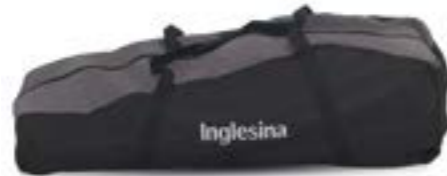
Bolsa de transporte de sillita de paseo Sac de transport pour poussette A099EG400