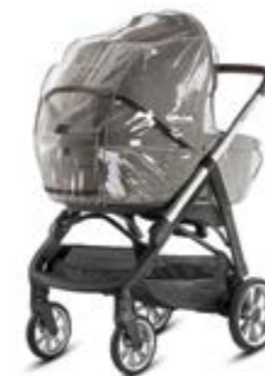
Burbuja para capazo Habillage pluie pour nacelle A096KB000