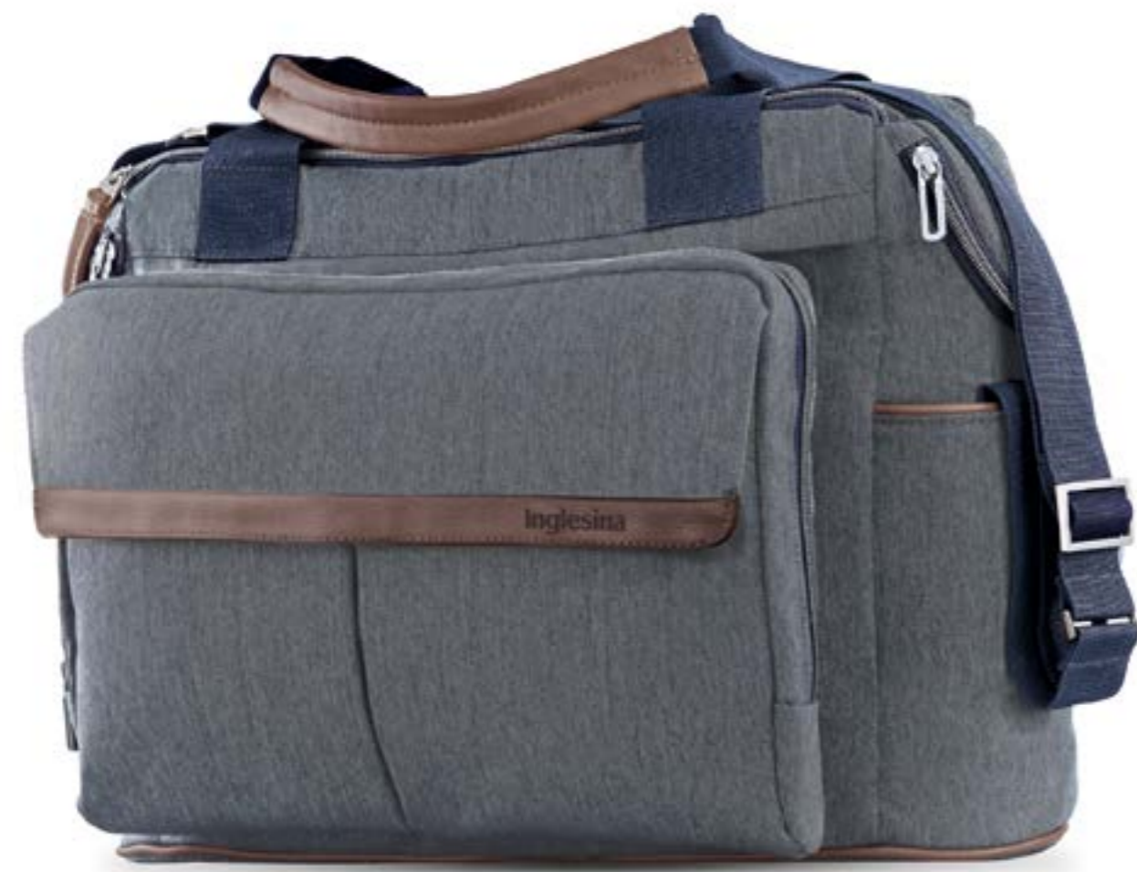
TAILOR DENIM AX91M0TLD