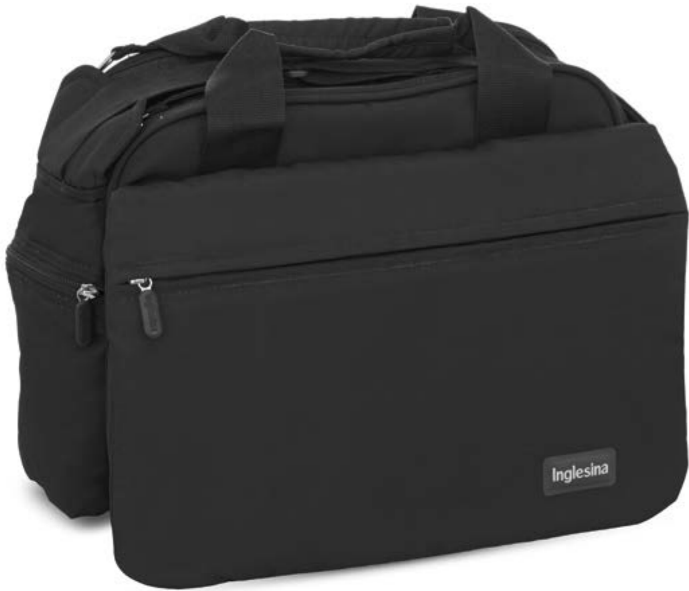
MY BABY BAG