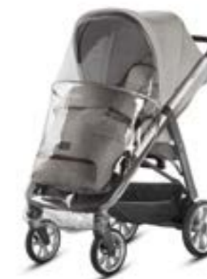
Burbuja para sillita de paseo Habillage pluie pour poussette A096KG000