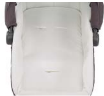
Colchón adicional para capazo Matelas additionnel pour nacelle A091KB203 Funda colchón capazo Housse de matelas A095KB203