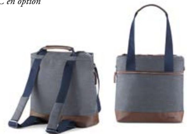
Back Bag AX70M0TLD