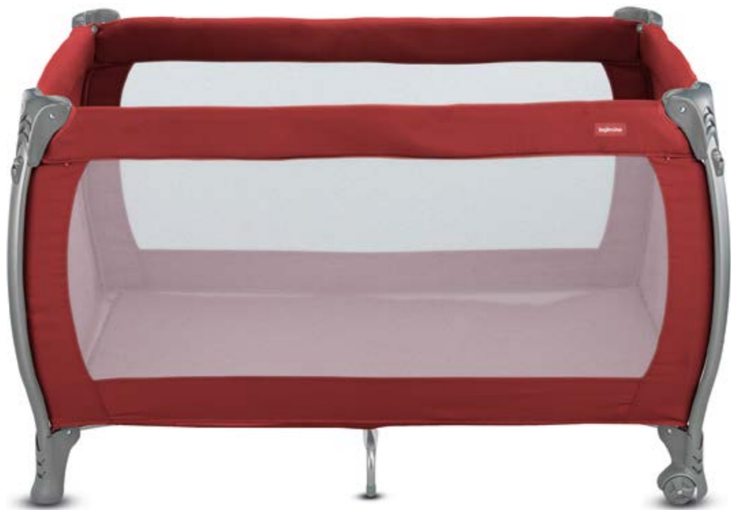
RED BRICK AZ94K9BRK