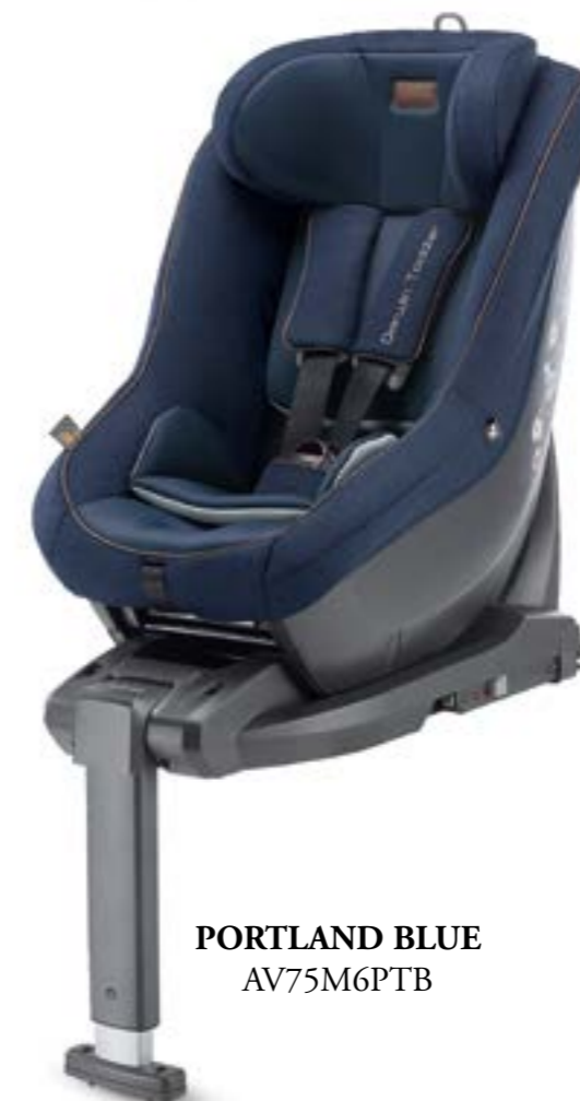
PORTLAND BLUE AV75M6PTB