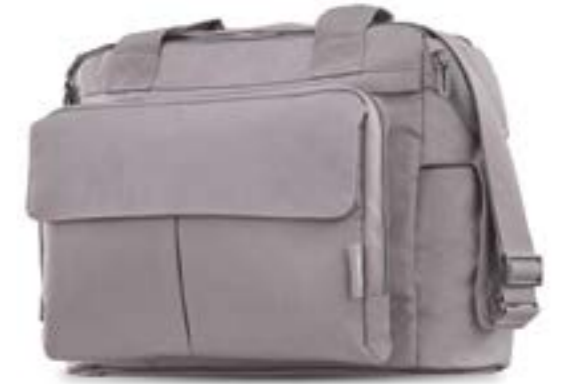
STONE GREY AX91M0STG