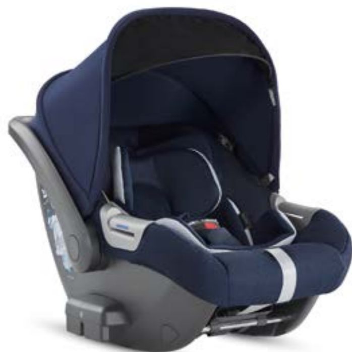
PORTLAND BLUE AV70M6PTB