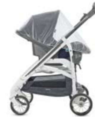
Mosquitera para portabebé Moustiquaire pour siège auto enfant A097KV000