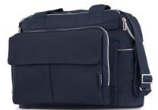
Dual Bag AX91K0LPA