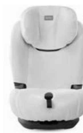
Funda de verano. Couverture d'été. A095KV953