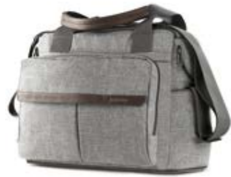
Dual Bag - bolsa modulable Descubra todas las variantes en la página 110 Dual Bag - Sac modulable Découvrez toutes les variantes page 110