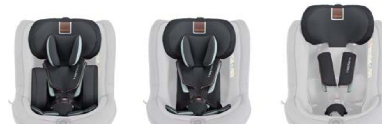
Reposacabezas envolvente de altura regulable (6 posiciones). La almohadilla reductora modulable se adecua al crecimiento del bebé. Appuie-tête enveloppant réglable en hauteur (6 positions). L'adaptateur suit la croissance du bébé.