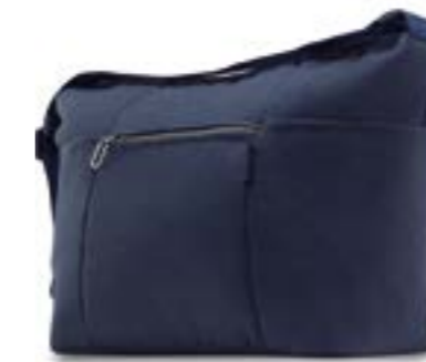
Day Bag - bolsa de uso diario Descubra todas las variantes en la página 118 Day Bag - Sac à usage quotidien Découvrez toutes les variantes page 118