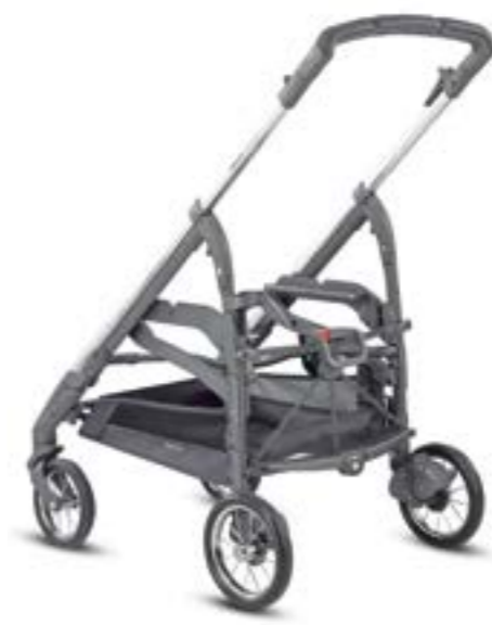
Chasis Cromado/Ardesia Châssis Chromel/Ardoise AE36K6100