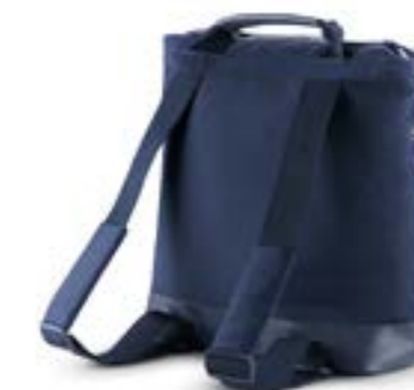
Back Bag - bolso mochila Descubra todas las variantes en la página 116 Back Bag - Sac à dos Découvrez toutes les variantes page 116