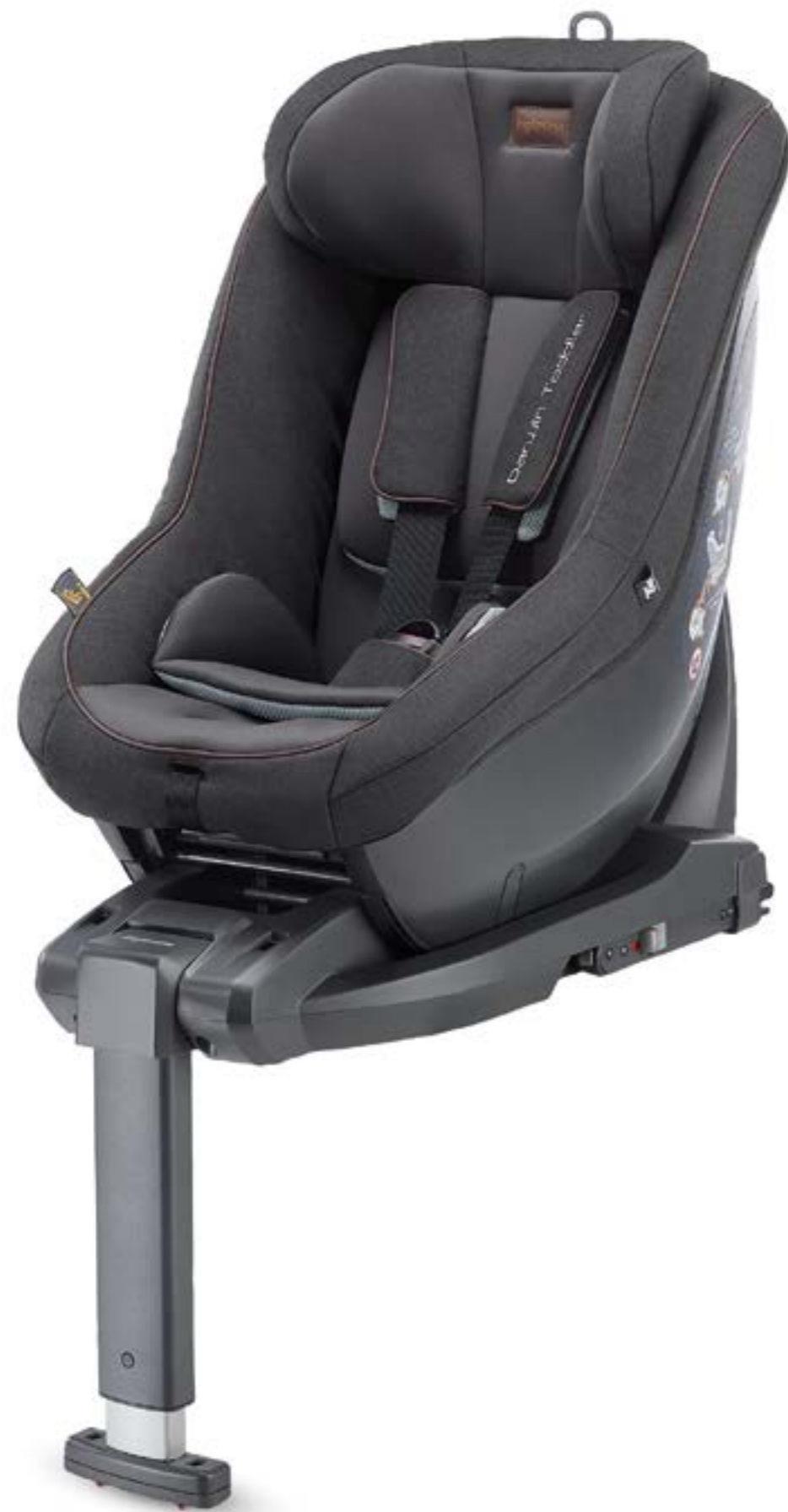
MYSTIC BLACK AV75M6MYB