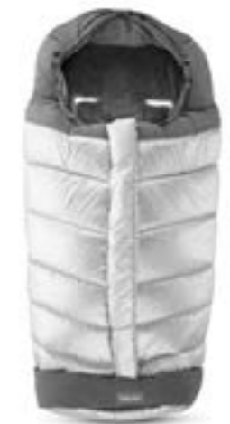
Saco de invierno para sillita de paseo. Descubra todas las variantes en la página 108 Chanceliere pour poussette Découvrez toutes les variantes page 108