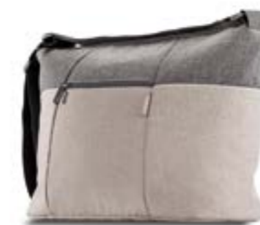
Day Bag AX35M0ITC