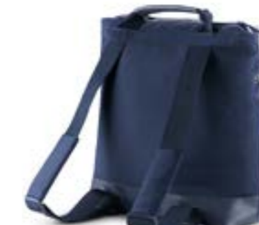
Back Bag - bolso mochila Descubra todas las variantes en la página 116 Back Bag - Sac à dos Découvrez toutes les variantes page 116