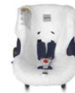
Funda de verano para portabebé Huggy Multifix Housse d'été pour siège auto Huggy Multifix A095FV603