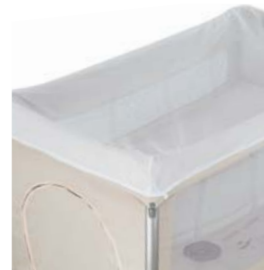
Mosquitera incluida. Moustiquaire intégré.