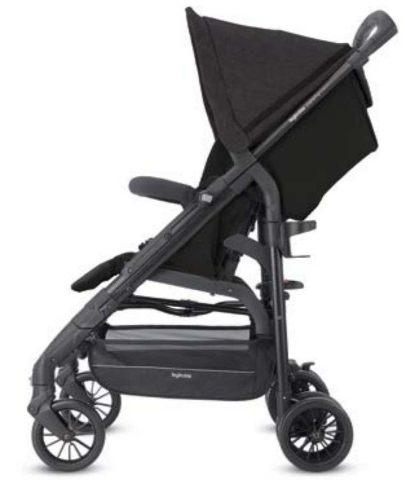
VOLCANO BLACK AG40K0VCB