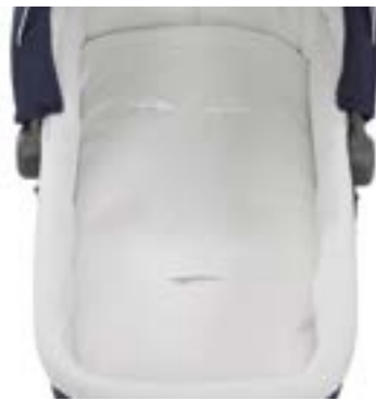
Colchón adicional para capazo Matelas additionnel pour nacelle A091KB203 Funda colchón capazo Housse de matelas A095KB203