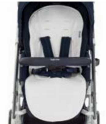
Funda de verano para sillita de paseo Housse d'été pour poussette A095KG003