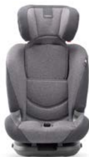
Grupo 3 (desde 22 hasta 36 kg) Groupe 3 (de 22 à 36 kg)