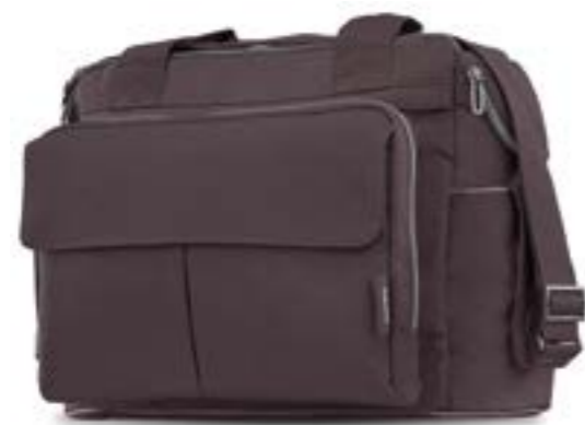
MARRON GLACÈ AX91K0MGL