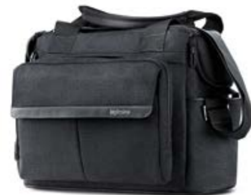
MYSTIC BLACK AX91M0MYB