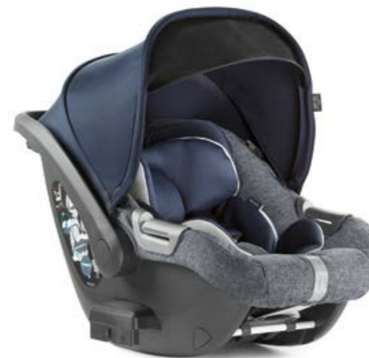
NIAGARA BLUE AV70K6NGB