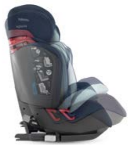
Asiento anatómico que puede reclinarse con una sola mano en 4 posiciones. Le siège peut être incliné à 4 positions avec une seule main.