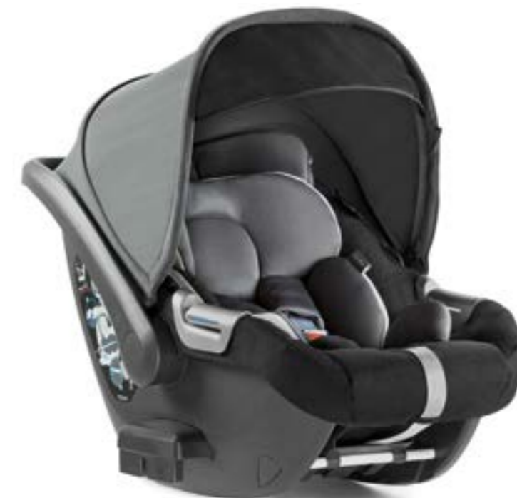
MYSTIC BLACK AV70K6MYB