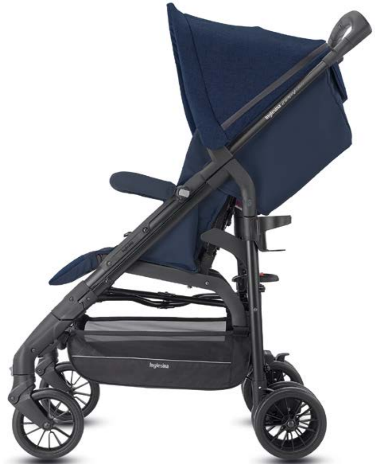
MIDNIGHT BLUE AG40K0MDB