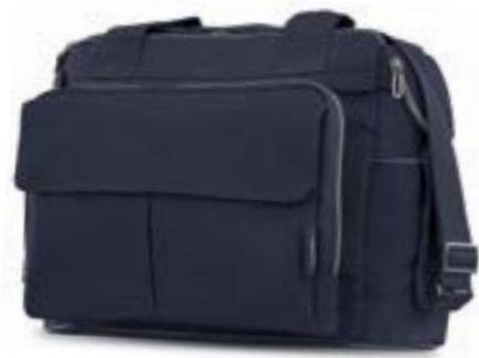
Dual Bag - bolsa modulable Descubra todas las variantes en la página 110 Dual Bag - Sac modulable Découvrez toutes les variantes page 110