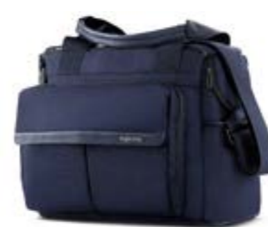
Dual Bag - bolsa modulable Descubra todas las variantes en la página 110 Dual Bag - Sac modulable Découvrez toutes les variantes page 110