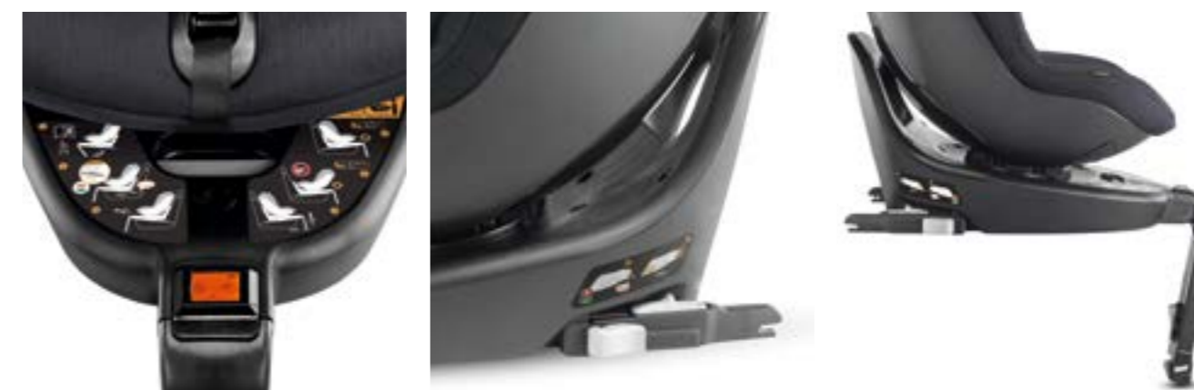
Pantalla LCD con indicadores de instalación correcta. Una señal acústica avisa de las siguientes situaciones: los conectores Isofix no se han acoplado correctamente, la pata de apoyo no se encuentra en la posición correcta o el asiento está orientado en dirección incorrecta.

Écran LCD avec indicateurs pour une installation correcte. Un signal sonore indique si la fixation est incorrecte. Connecteurs Isofix, la position incorrecte du support jambe de force ou la mauvaise position du siège auto.