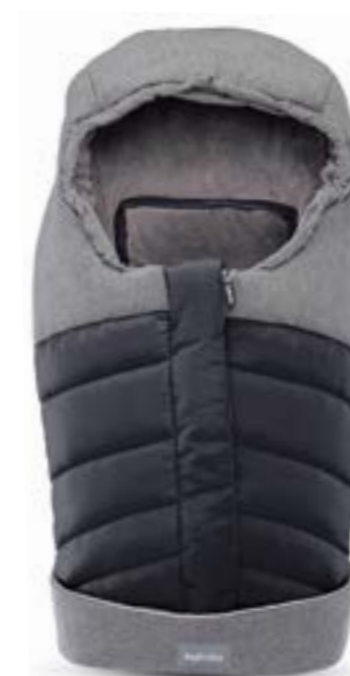
ONYX BLACK A099K2ONB