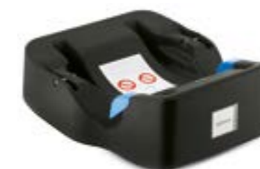
Base Universal para portabebé Huggy Multifix Base Universelle pour siège auto Huggy Multifix AV00D6100