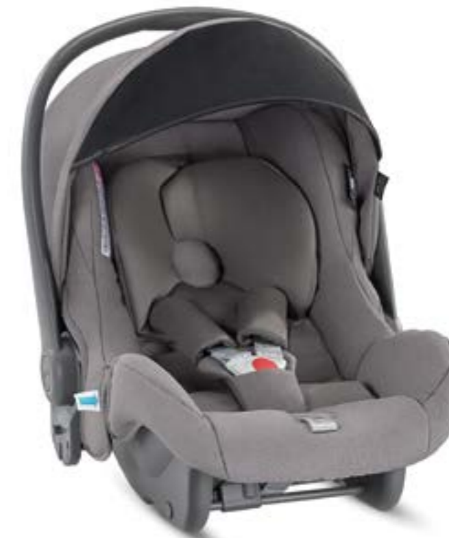
STONE GREY AV35M6STG