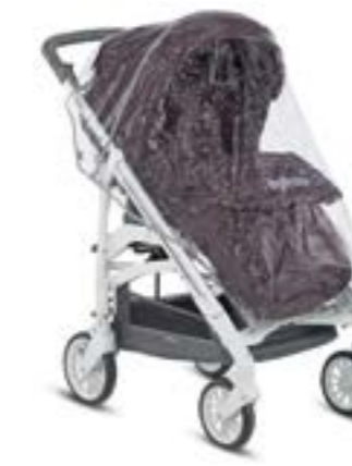
Burbuja para sillita de paseo Habillage pluie pour poussette A096KG000