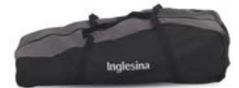
Bolsa de transporte de sillita de paseo Sac de transport pour poussette A099EG400