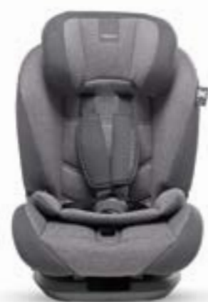
Grupo 1 (desde 9 hasta 18 kg) Groupe 1 (de 9 à 18 kg)