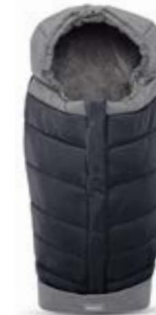
Saco de invierno para sillita de paseo. Descubra todas las variantes en la página 108 Chancelière pour poussette Découvrez toutes les variantes page 108