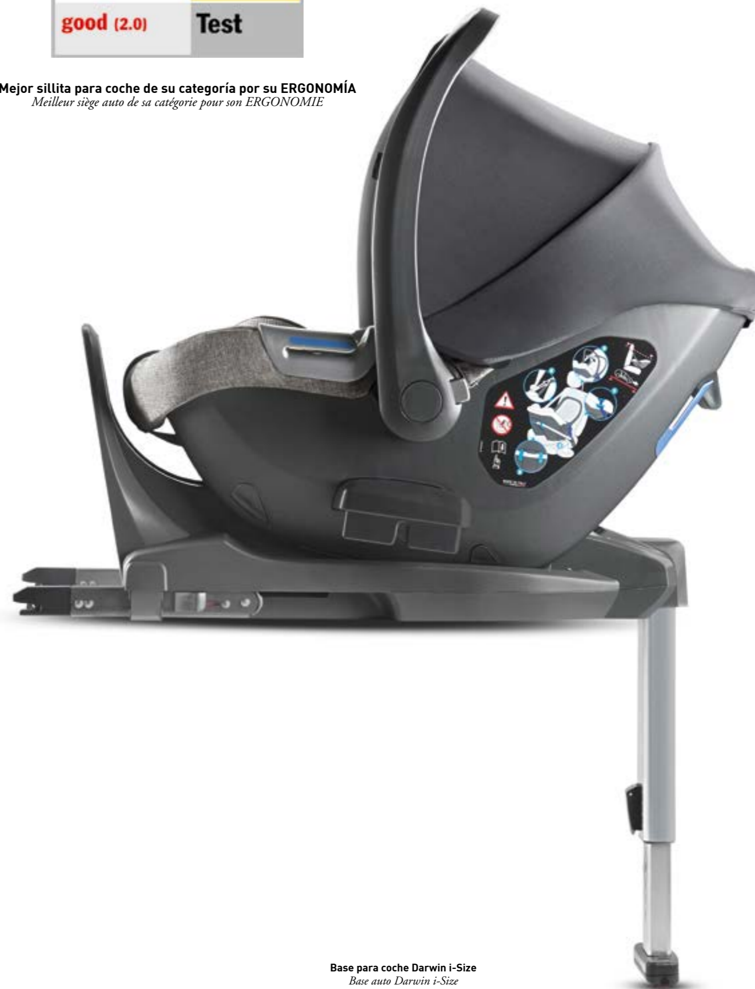
Base para coche Darwin i-Size Base auto Darwin i-Size

Mejor sillita para coche de su categoría por su ERGONOMÍA Meilleur siège auto de sa catégorie pour son ERGONOMIE