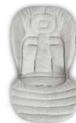
Baby Snug Pad - Cojín reductor Baby Snug Pad - Coussin réducteur A091KC005