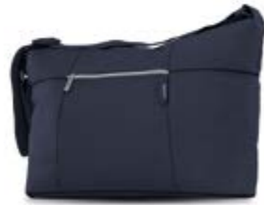
Day Bag - bolsa de uso diario Descubra todas las variantes en la página 118 Day Bag - Sac à usage quotidien Découvrez toutes les variantes page 118