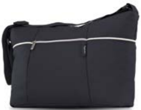
Day Bag AX33K0PNT