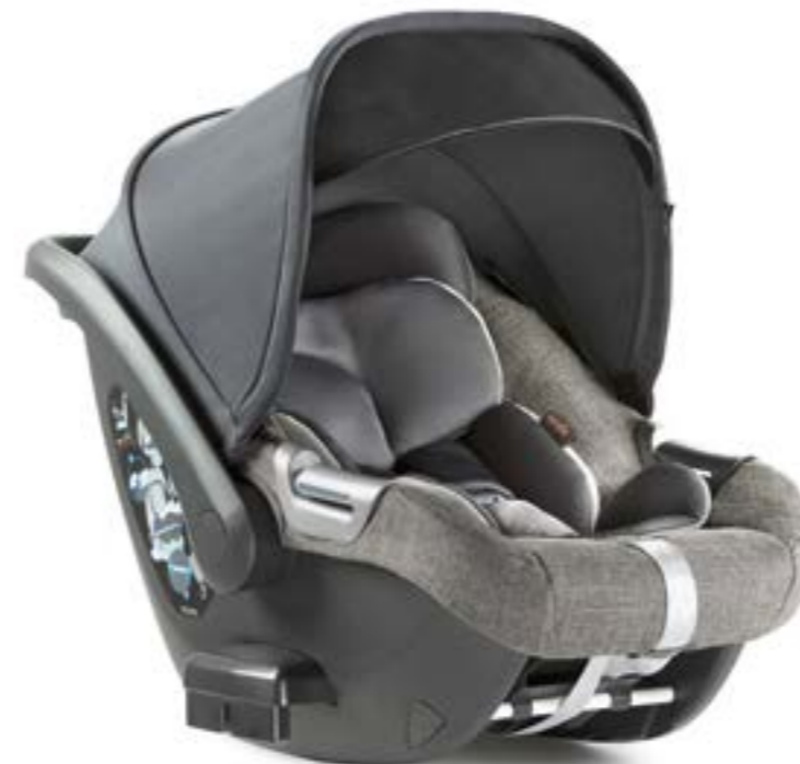
MINERAL GREY AV70K6MNG