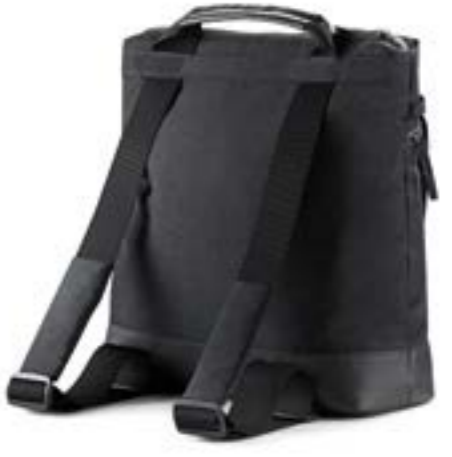
MYSTIC BLACK AX70M0MYB