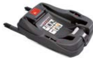
Base Isofix para portabebé Huggy Multifix Base Isofix pour siège auto Huggy Multifix AV02D6100