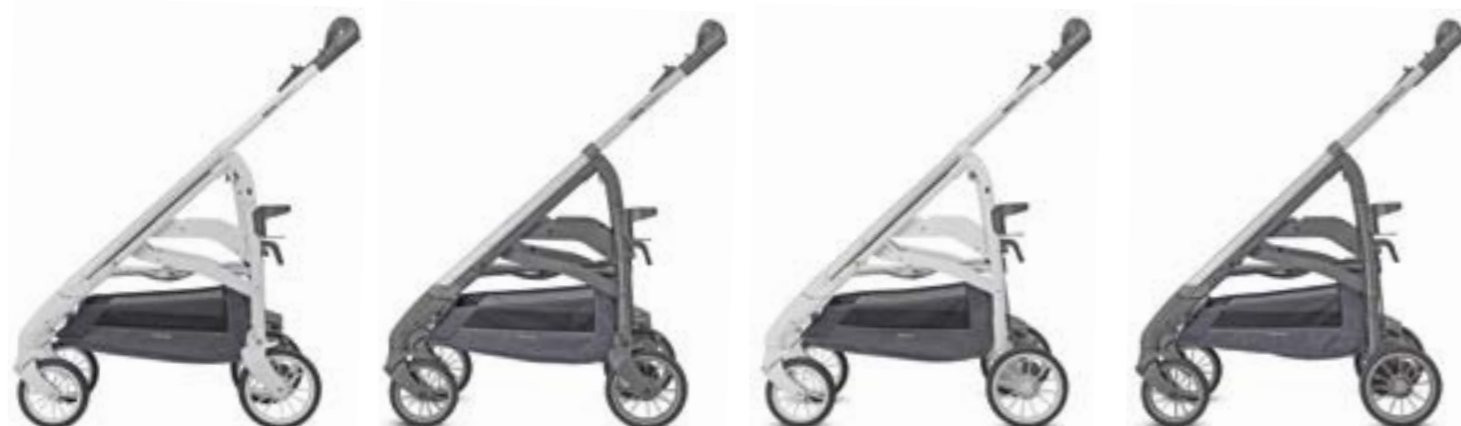
Chasis City Silver/Blanco Châssis City Argent/Blanc AE38K3200