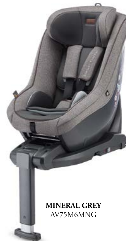
MINERAL GREY AV75M6MNG