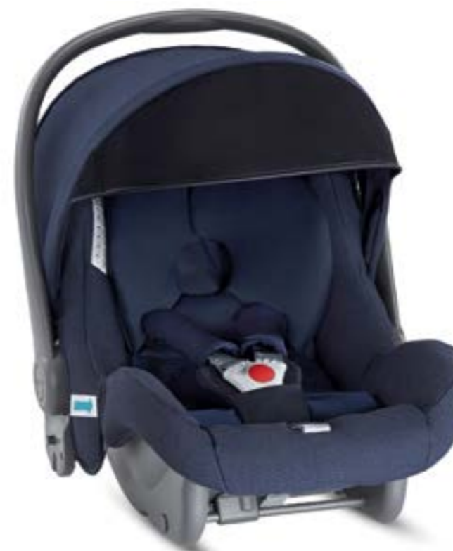
SAILOR BLUE AV35M6SLB