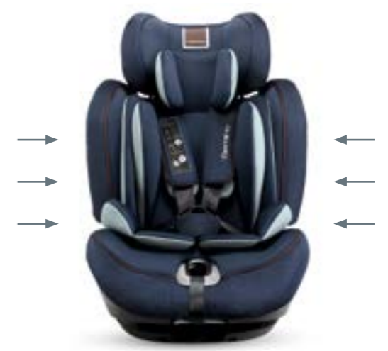
Tecnología Side Head Protection para una mayor absorción de energía en caso de impacto lateral. Technologie Side Head Protection, pour augmenter l'absorption d'énergie en cas de choc latéral.