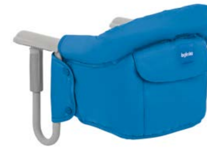
LIGHT BLUE AY90G5LBL