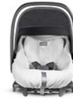
Funda de verano para portabebé Cab 0+ / Darwin Infant i-Size Housse d'été pour siège auto Cab 0+ / Darwin Infant i-Size A095KV703