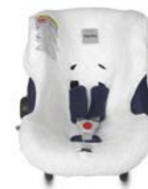
Funda de verano para portabebé Huggy Multifix Housse d'été pour siège auto Huggy Multifix A095FV603