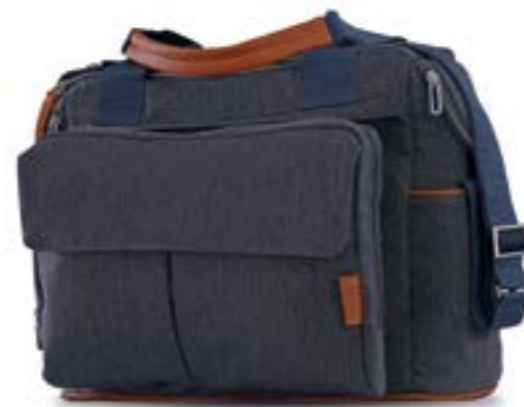
VILLAGE DENIM AX91M0VLD