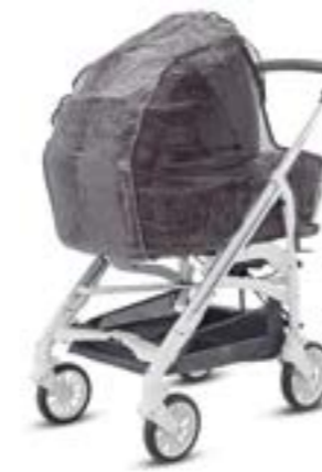
Burbuja para capazo Habillage pluie pour nacelle A096KB000