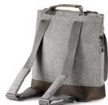
Back Bag - bolso mochila Descubra todas las variantes en la página 116 Back Bag - Sac à dos Découvrez toutes les variantes page 116