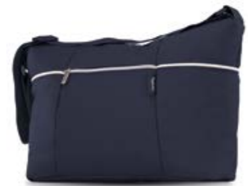
Day Bag AX33K0LPA