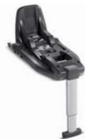
Base i-Size para portabebé Darwin Infant i-Size y Darwin Toddler i-Size (ECE R129) Base i-Size pour siège auto Darwin Infant i-Size et Darwin Toddler i-Size (ECE R129) AV03K6200