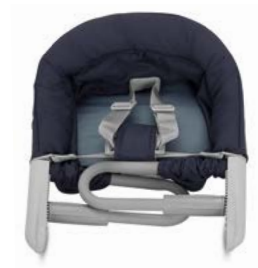
Compacta una vez plegada. Desenfundable y lavable. Compact une fois pliée. Déhoussable et lavable.