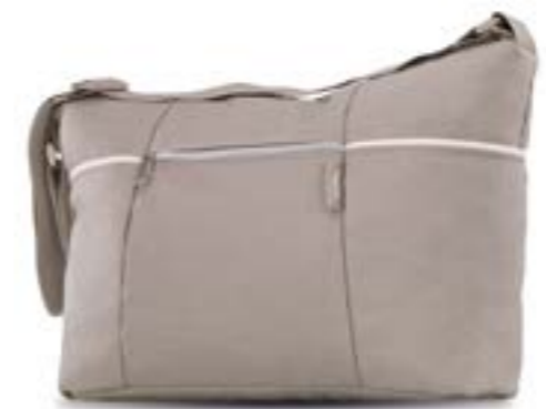
Day Bag AX33K0PNR