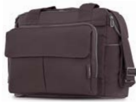
Dual Bag - bolsa modulable Descubra todas las variantes en la página 110 Dual Bag - Sac modulable Découvrez toutes les variantes page 110