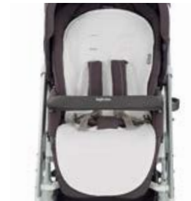
Funda de verano para sillita de paseo Housse d'été pour poussette A095KG003