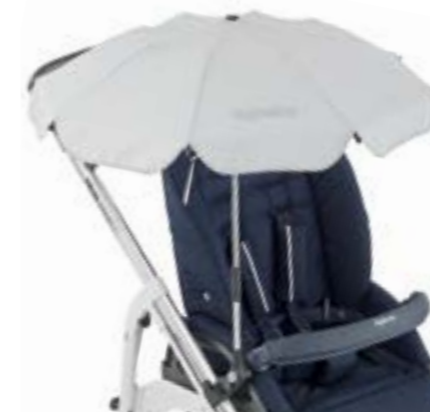
Sombrilla para el sol Ombrelle A099H0BLK · A099H0BLU A099H0CRE · A099H0FUX A099H0GRN · A099H0LBL A099H0RED · A099H0SLV