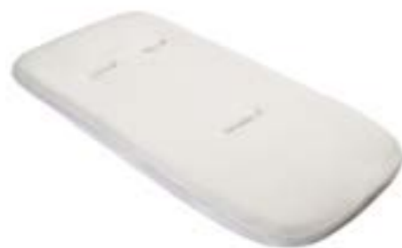
Colchón adicional para capazo Matelas additionnel pour nacelle A091KB703