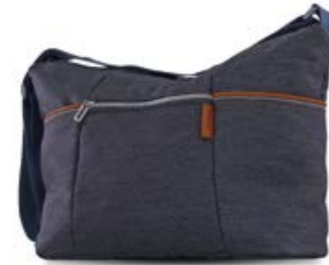
VILLAGE DENIM AX35M0VLD