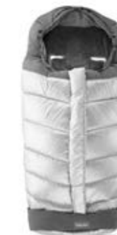
Saco de invierno para sillita de paseo. Descubra todas las variantes en la página 108 Chancelière pour poussette Découvrez toutes les variantes page 108