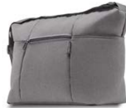
STONE GREY AX35M0STG