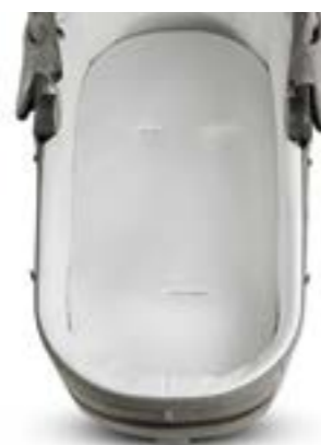
Funda de colchón de cuna Housse de matelas A095KB703