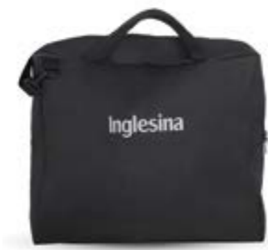
Bolsa de transporte de sillita de paseo Sac de transport pour poussette A099LG870