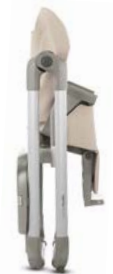
Cuando se cierra ocupa muy poco espacio y permanece en vertical de manera autónoma. Une fois replié, il occupe très peu de place et tient debout tout seul.