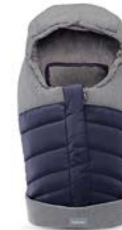
Saco de invierno para capazo y portabebé. Descubra todas las variantes en la página 106 Chanceliere pour nacelle et siège auto Découvrez toutes les variantes page 106