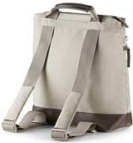
CASHMERE BEIGE AX70M0CMB