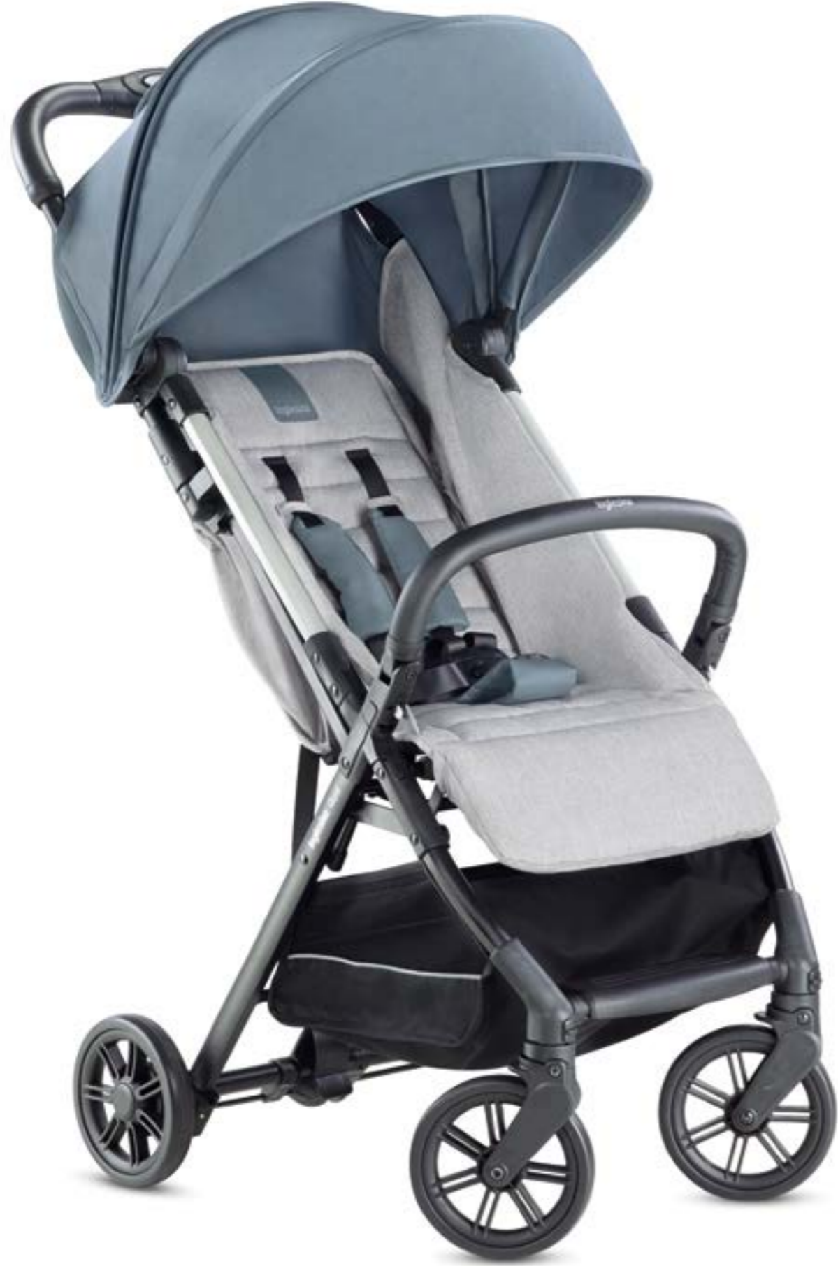
STORMY GREY AG87L0STG