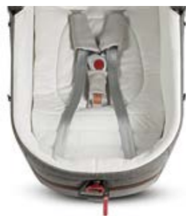
Kit Auto para capazo Kit Auto Maxi pour nacelle A090KB700