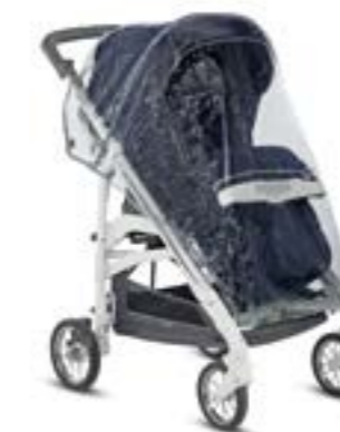
Burbuja para sillita de paseo Habillage pluie pour poussette A096KG000