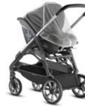
Mosquitera para portabebé Moustiquaire pour siège auto enfant A097KV000