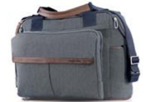
Dual Bag AX91M0TLD