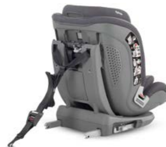
Sistema de anclaje Isofix y Top Tether, para una instalación fácil y segura del automóvil. Système de retenue pour enfants avec connecteurs Isofix et Top Tether pour une installation confortable et en toute sécurité dans la voiture.