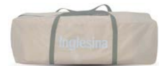
Bolsa de transporte incluida. Sac de transport intégré.