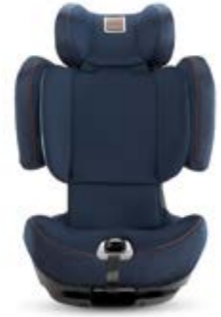
Grupo 2-3 (de 15 a 36 kg) Groupe 2-3 (de 15 à 36 kg)

Al pasar del grupo 1 a los siguientes, los cinturones de la sillita se pueden esconder fácilmente debajo del revestimiento, por lo que no es preciso quitarlos.