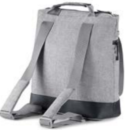
SILK GREY AX70M0SLG