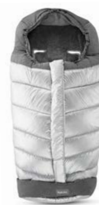
CYBER SILVER A099K1CSL