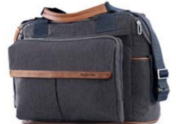
INDIGO DENIM AX91K0IND/X