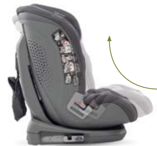
El asiento se puede reclinar en 4 posiciones con una sola mano. L'assise anatomique est inclinable d'une seule main en 4 positions, ce qui assure un voyage confortable et relaxant.