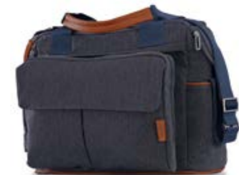
Dual Bag AX91M0VLD