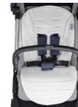
Funda de verano para sillita de paseo Housse d'été pour poussette A095KG003