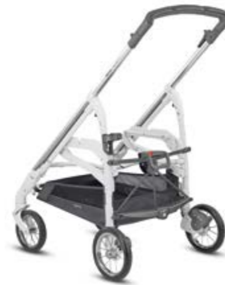
Chasis Cromado/Blanco Châssis Chromel/Blanc AE36K3200