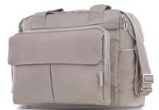
Dual Bag AX91K0PNR