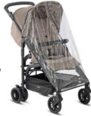
Burbuja de lluvia suministrada de serie Habillage pluie fournie en série

Poussette ouverte: 48 x 101,5 x 80 cm Poussette fermée: 31 x 96 x 32 cm Poids de la poussette: 7 kg