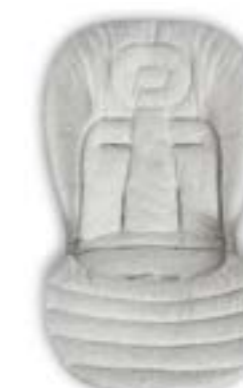
Baby Snug Pad - Cojín reductor Baby Snug Pad - Coussin réducteur A091KC005