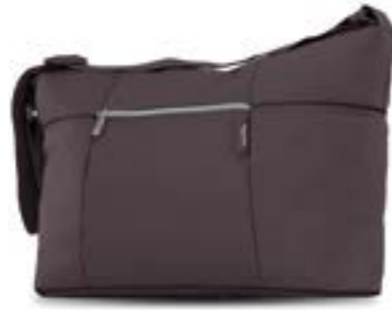
Day Bag - bolsa de uso diario Descubra todas las variantes en la página 118 Day Bag - Sac à usage quotidien Découvrez toutes les variantes page 118