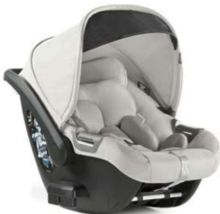
SILK GREY AV70M6SLG