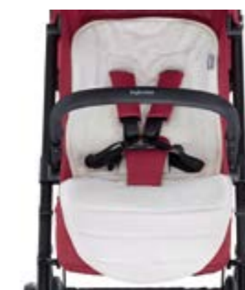
Funda de verano para sillita de paseo Housse d'été pour poussette A095KG003