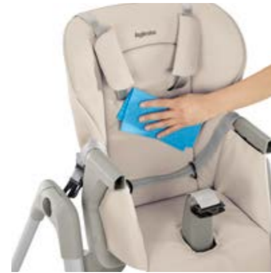
Tejido fácilmente lavable y antimanchas. Revestimiento completamente desfundable y lavable a mano. Housse de siège résistant aux taches et facilement lavable. Doublure entièrement détachable et lavable à la main.