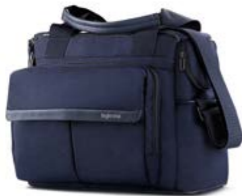
PORTLAND BLUE AX91M0PTB