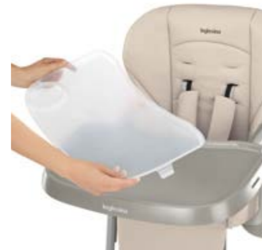
Bandeja de superficie lavable en el lavavajillas. Plateau de service lavable au lave-vaisselle.