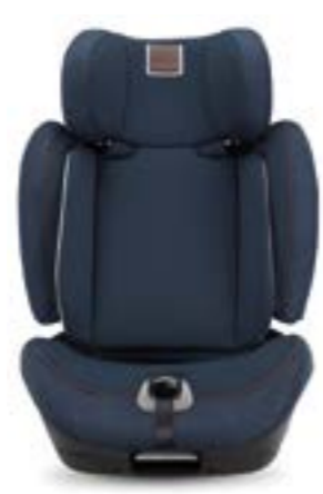
Grupo 2 (de 15 a 25 kg) Groupe 2 (de 15 à 25 kg)