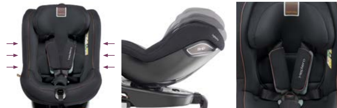
Sistema de protección contra golpes laterales (SHP). Asiento ergonómico reclinable en 3 posiciones. Système de protection latérale de la tête (SHP). Siège ergonomique inclinable sur 3 positions.