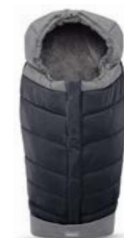
Saco de invierno para sillita de paseo. Descubra todas las variantes en la página 10 Chanceliere pour poussette Découvrez toutes les variantes page 108