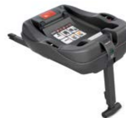
Base Isofix para portabebé Huggy Multifix Base Isofix pour siège auto Huggy Multifix AV02D6100