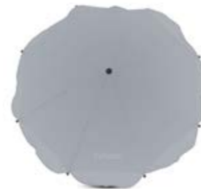
Sombrilla para el sol Ombrelle

A099H0BLK • A099H0BLU A099H0CRE • A099H0FUX A099H0GRN • A099H0LBL A099H0RED • A099H0SLV