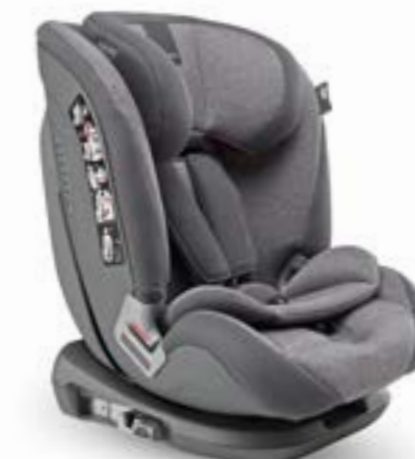
La forma envolvente e inclinada del reposacabezas impide que la cabeza del niño se deslice durante el sueño. Revestimiento textil desfundable y lavable a mano a 30 °C. La forme enveloppante et inclinée de l'appui-tête soutient la tête de l'enfant durant son sommeil. Intérieurs textile amovibles et lavables à la main à 30°C.