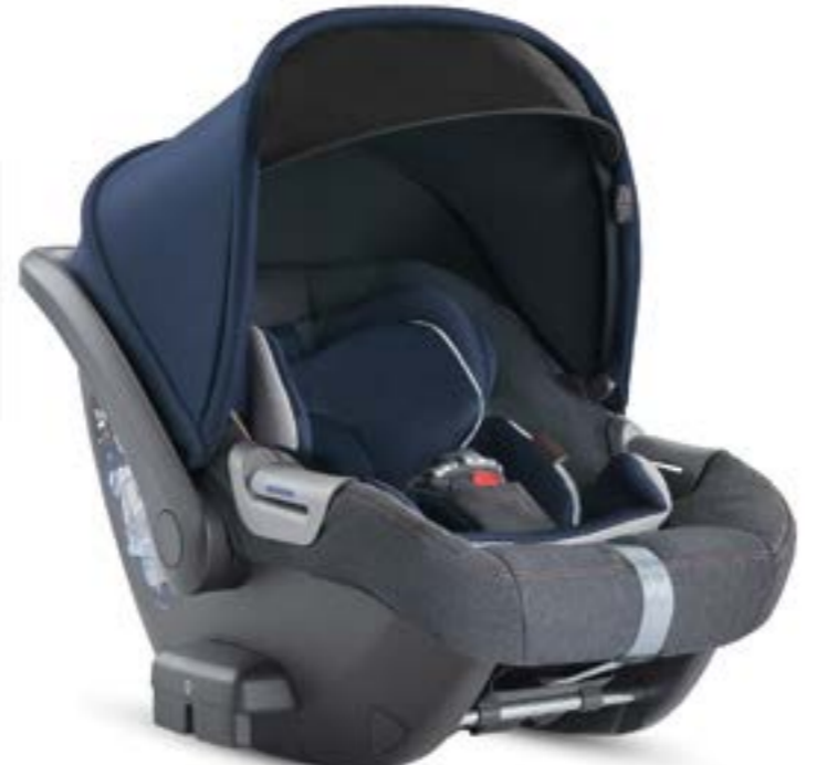
TAILOR DENIM AV71M6TLD