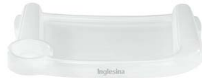
Bandeja Plateau A098AY901