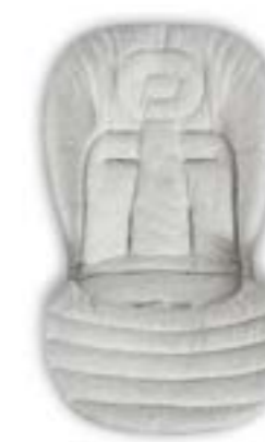
Baby Snug Pad - Cojín reductor Baby Snug Pad - Coussin réducteur A091KC005