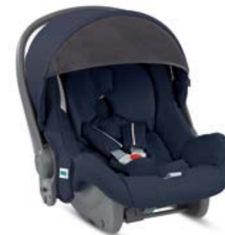
Huggy Multifix Gr. 0+ Infant Car Seat