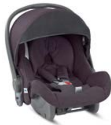
Huggy Multifix Gr. 0+ Infant Car Seat