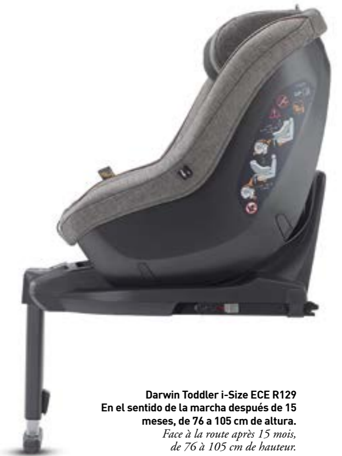
Darwin Toddler i-Size ECE R129 En el sentido de la marcha después de 15 meses, de 76 a 105 cm de altura. Face à la route après 15 mois, de 76 à 105 cm de hauteur.