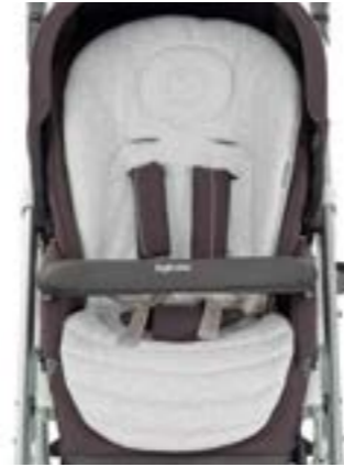
Baby Snug Pad - Cojín reductor Baby Snug Pad - Coussin réducteur A091KC005