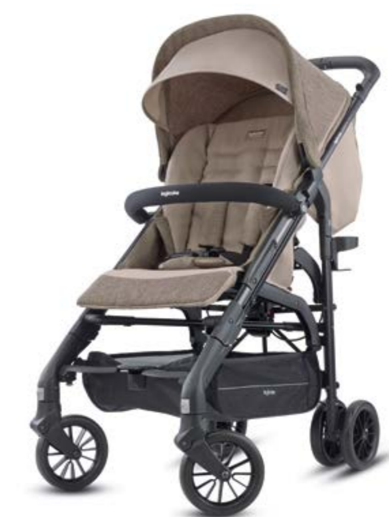
SAFARI BEIGE AG40K0SFB