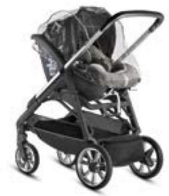
Burbuja para portabebé Cab 0+ / Darwin Infant i-Size Habillage pluie pour siège auto Cab 0+ / Darwin Infant i-Size A096FV600