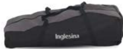
Bolsa de transporte de sillita de paseo Sac de transport pour poussette A099EG400