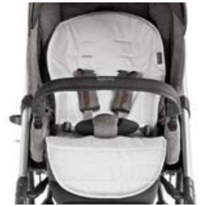
Funda de verano para sillita de paseo Housse d'été pour poussette A095KG003