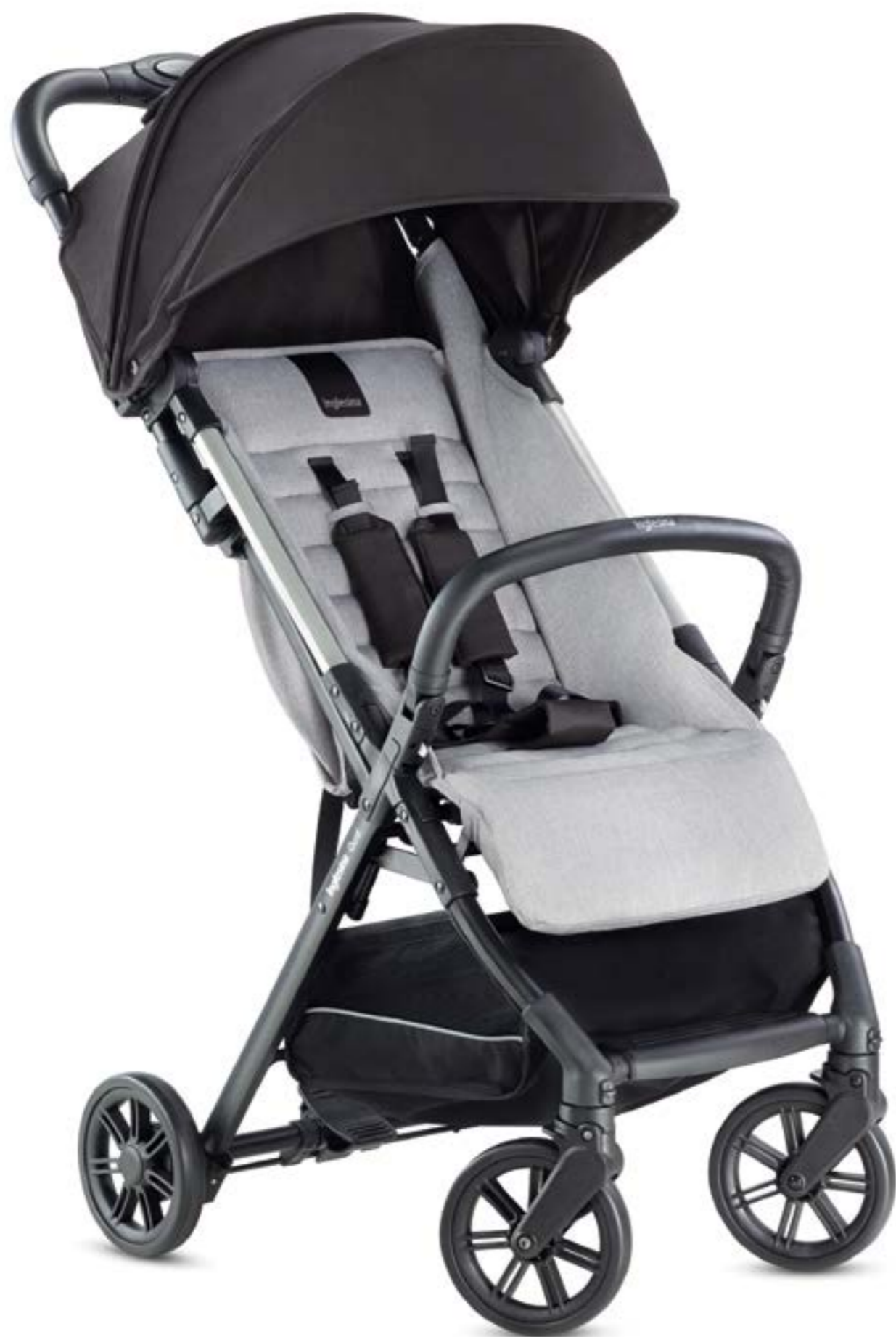
ROCK BLACK AG87L0RCB