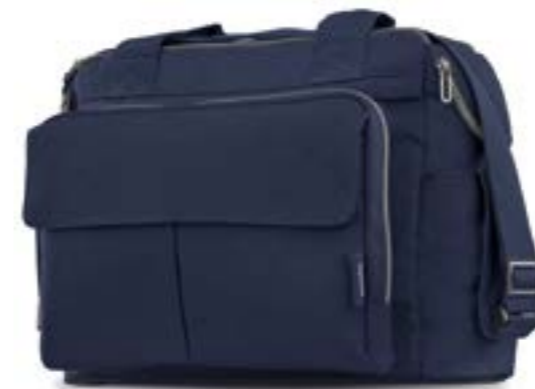
SAILOR BLUE AX91M0SLB