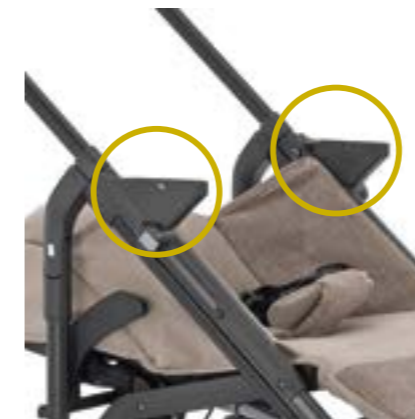
Adaptadores para Huggy Gr.0+ Adaptateurs pour Huggy Groupe 0+ A098HE4000