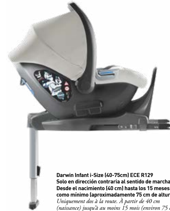
Darwin Infant i-Size (40-75cm) ECE R129 Solo en dirección contraria al sentido de marcha. Desde el nacimiento (40 cm) hasta los 15 meses como mínimo (aproximadamente 75 cm de altura). Uniquement dos à la route. À partir de 40 cm (naissance) jusqu'à au moins 15 mois (environ 75 cm).