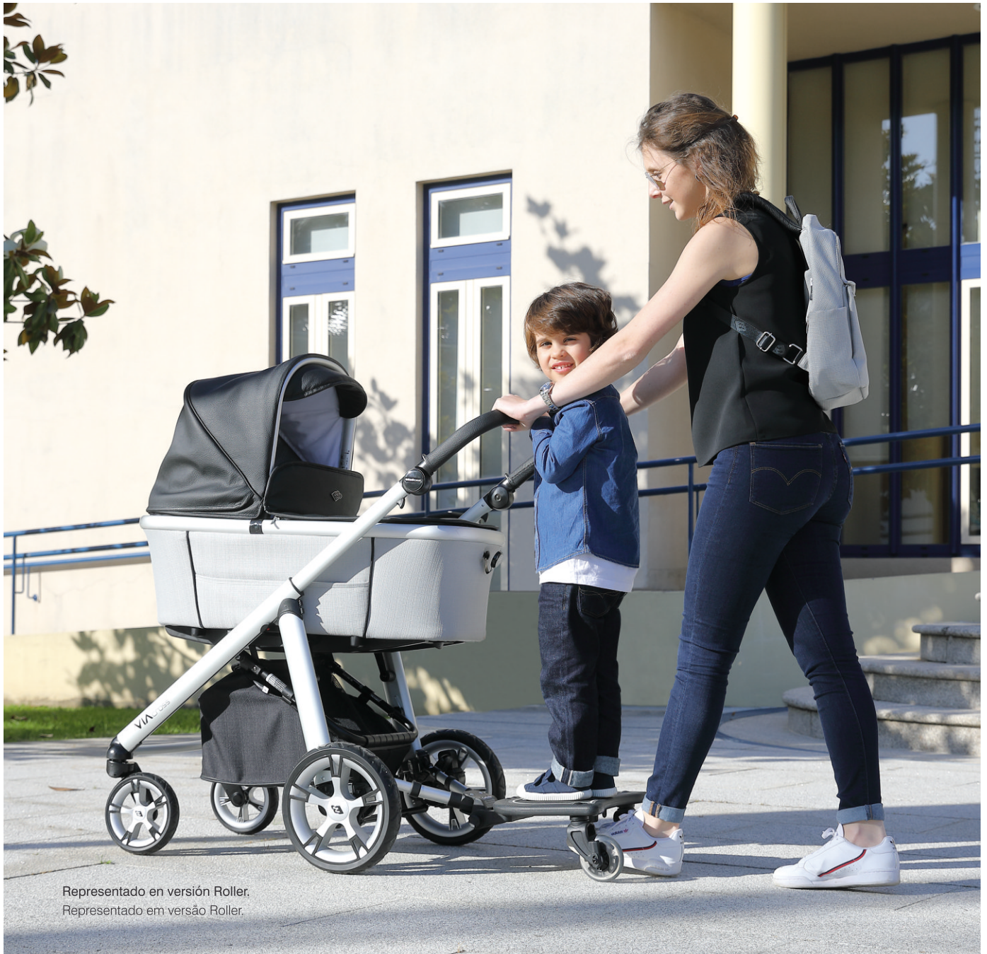
Representado en versión Roller. Representado em versão Roller.

El Roller destaca por su practicidad al poderse enganchar a prácticamente todos los cochecitos, sillas de paseo y sillas ligeras del mercado.