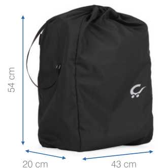
Peso aprox.: 5.7 kg

Ref. 8116: Silla + reductor + bolsa de transporte | Cadeira + reductor + saco de transporte