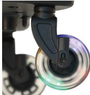
Ruedas duraderas de PU con luces intermitentes. Rodas em PU durável com luzes intermitentes.