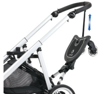
Correa ajustable para cuando no esté en uso. Correia regulável para quando não está a ser usado.