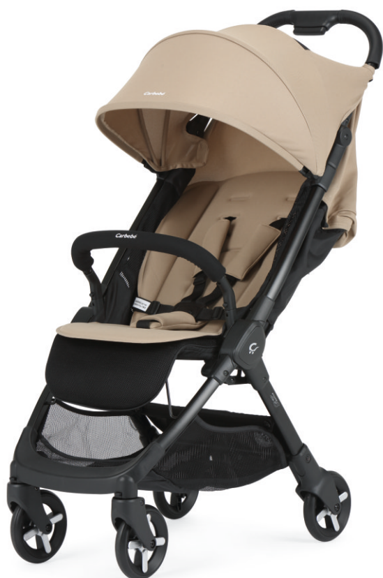
Beige | Bege