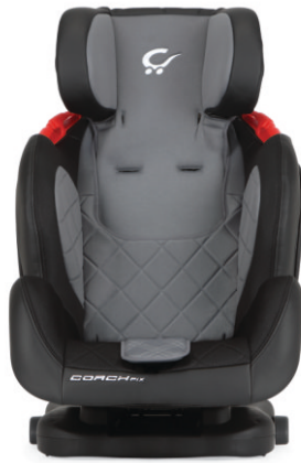
Grupo 2, 3