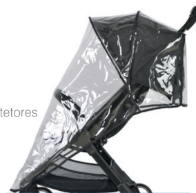
Cobertura de lluvia Cobertura de chuva