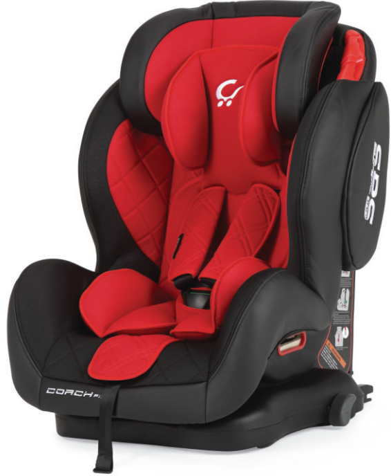
Negro - Rojo | Preto - Vermelho