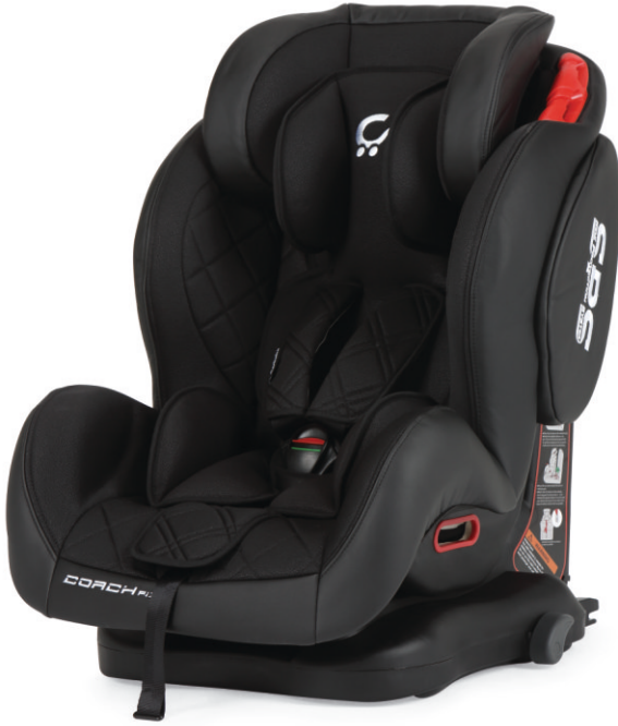
Negro | Preto