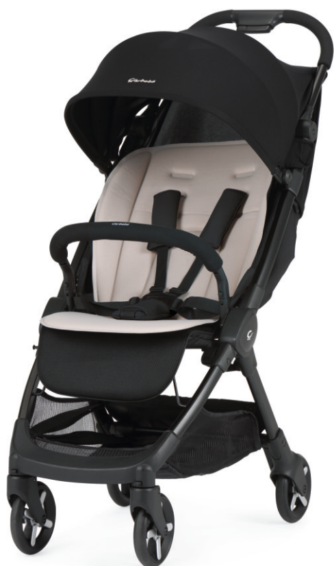
Negro | Preto