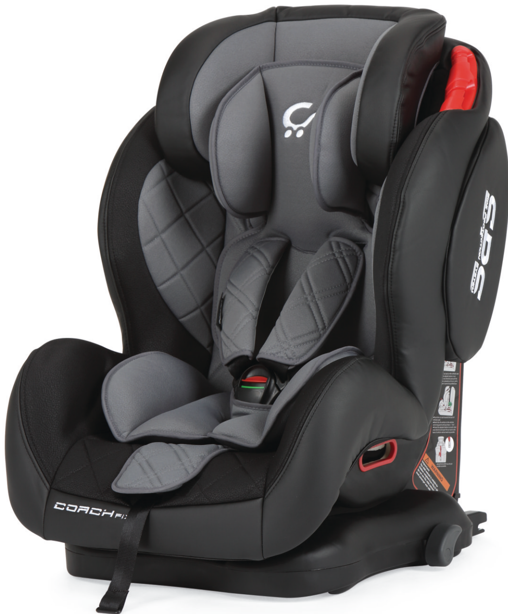
Negro - Gris | Preto - Cinza

Disponibile en Negro (PRX) | Negro - Gris (CZX) | Negro - Rojo (VRX) Disponível em Preto (PRX) | Preto - Cinza (CZX) | Preto - Vermelho (VRX)