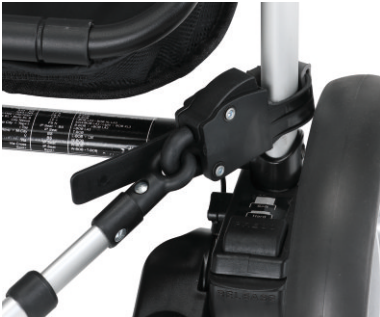
Sistema de fijación rápido y fácil. Sistema de fixação rápido e fácil.